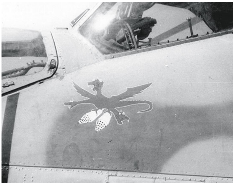
Змей Горыныч на бортах другого Ми-24В из состава 262-й овэ. Баграм, осень 1988 года

На самолетах в камуфляжной окраске допускалось нанесение бортовых номеров только белым кантом по цветной подложке основной окраски. В таком виде машины часто приходили с завода или прибывали из ремонта, предоставляя выполнять окончательную доводку номеров уже на местах. В частях белый кант обычно заливался одним из указанных цветов, превращая номер в цветной, но иногда и «нештатным» белым цветом или оставался контурным без