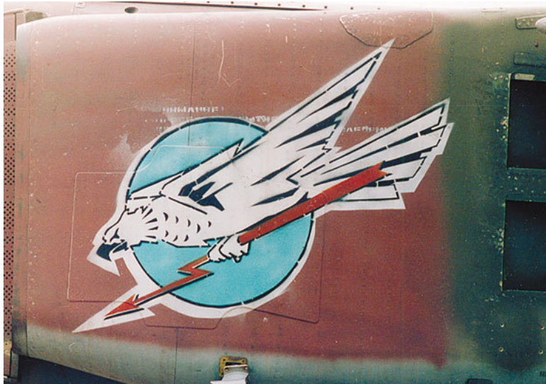
Изображение пикирующего сокола на борту Ми-Г-23МЛД 168-го иап