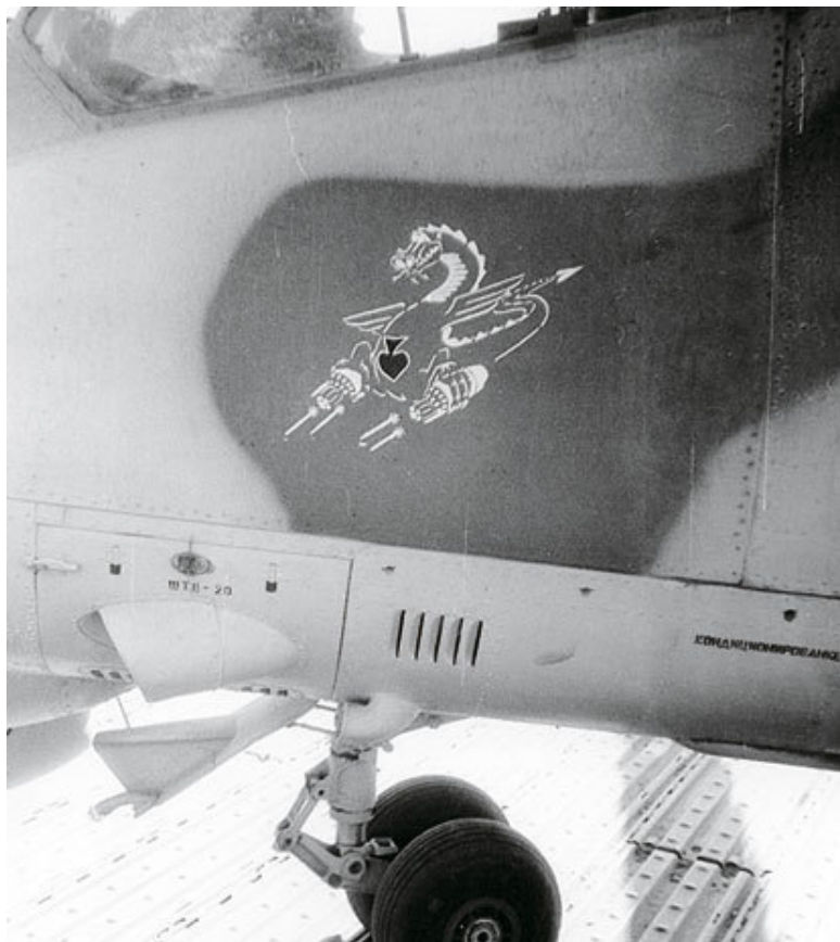
Дракон с пиковым тузом на Ми-24В из 262-й овэ

несении их на тёмный фон в белый цвет, на светлый фон – в красный цвет».