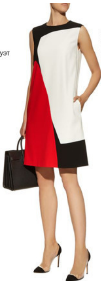
Силуэт прямого кроя