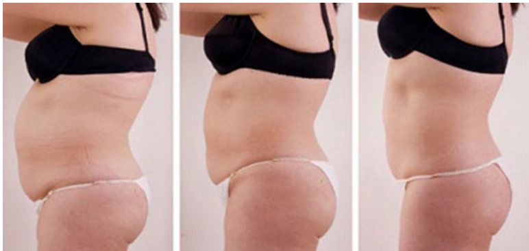
Надутый живот Круга.