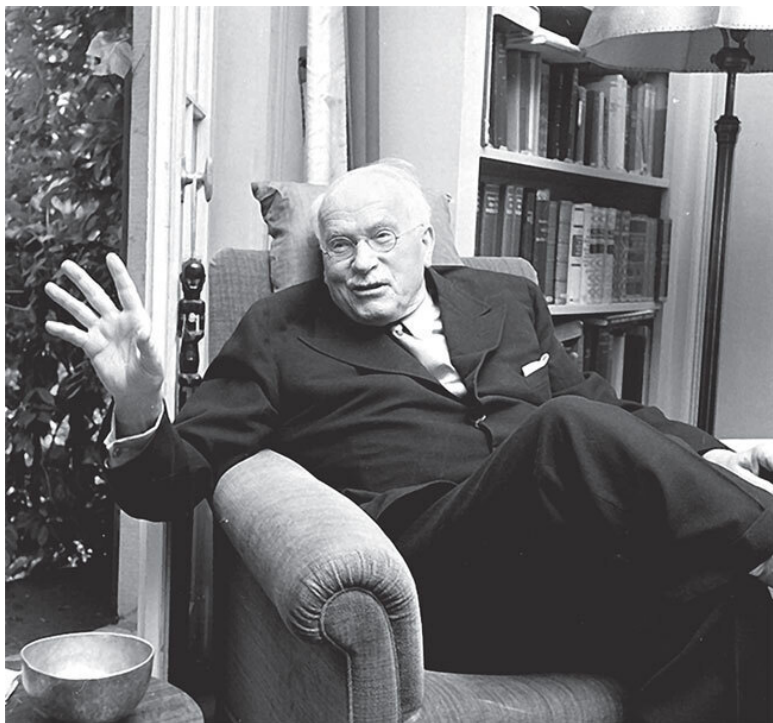
К. Г. Юнг

Насекомых я считал «ненастоящими» животными, а позвоночные для меня являлись лишь какой-то промежуточной стадией на пути к насекомым. Создания, относившиеся к этой категории, предназначались для наблюдения и коллекционирования, они были интересны в своем роде, но не имели человеческих свойств, а были всего-навсего проявле-