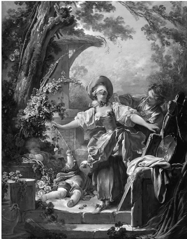
Игра в жмурки.