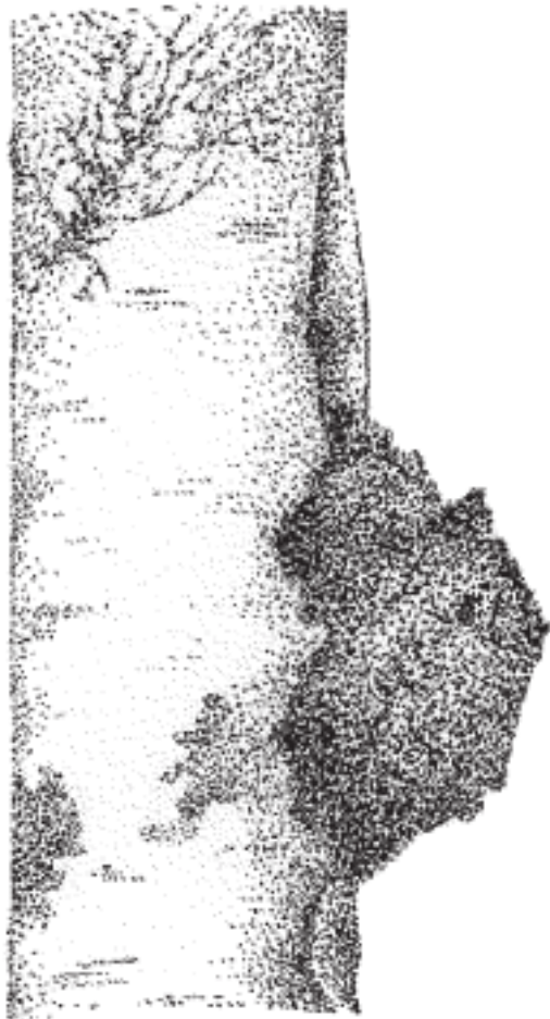
Рис. 1. Березовый гриб чага