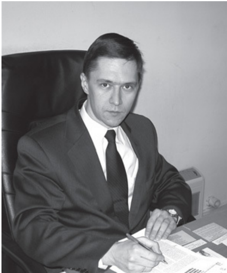
Управляющий партнер Консалтинговой группы «Юстицинформ», заведующий отделом научных договорных работ