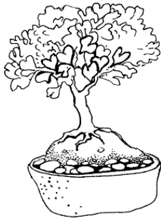
Рис. Композиция с бансай.

Культура бансай предусматривает некоторые первоочередные решения, специальную агротехнику и методы, которые необходимо рассмотреть перед тем, как переходить к основному и подробному описанию. Некоторые бансай произрастают и развиваются из семян, другие начинаются с черенков и отводки. В первую очередь, следует выбрать определенный вид растения. Начинать надо с тех видов растений, которые произрастают в данной местности. В регионах с прохладным климатом это могут быть хвойные растения, цветущие и плодоносящие виды.