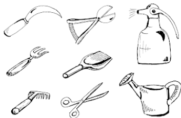
Рис. Инвентарь для ухода за комнатными растениями.

Приобретение этого нехитрого инвентаря не представляет никаких трудностей. А для хранения всех этих принадлежностей лучше выделить ящичек на кухне или на балконе.