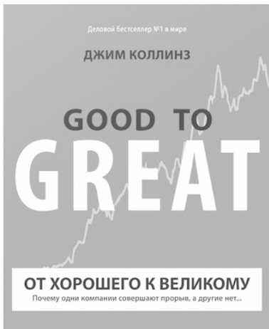
Рис 1.2. «От хорошего к великому»

В самом конце книги «Дао Toyota» есть отсылка к кни-