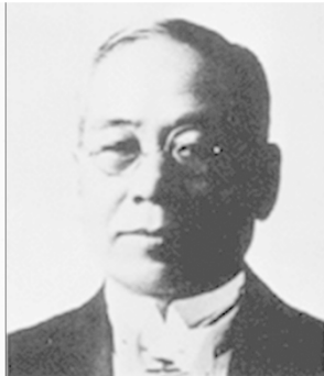
Рис 1.3. Один из первых автоматических ткацких станков и его создатель Сакити Тоёда

Поскольку он был плотником, то хорошо разбирался в дереве и деревообработке, был изобретателем и мог воплощать свои придумки в жизнь. В итоге он смог построить ткацкий станок. Первый станок, который он изобрел, был прост и использовал силу тяготения. Традиционно женщины протаскивали челночную нить (уток) в одну сторону и обратно, после чего вручную толкали кусок дерева для закрепления узелков. Собственно, в этом и заключалась работа ткачих – продеть нить в одну сторону и обратно, а затем уплотнить полотно. Он подумал, что продевание нити может происходить под действием гравитации, и изобрел деревянный желоб и систему с ножными педалями, с помощью которых можно было перемещать челнок по желобу взад и вперед. Такая система избавляла по меньшей мере от половины трудозатрат