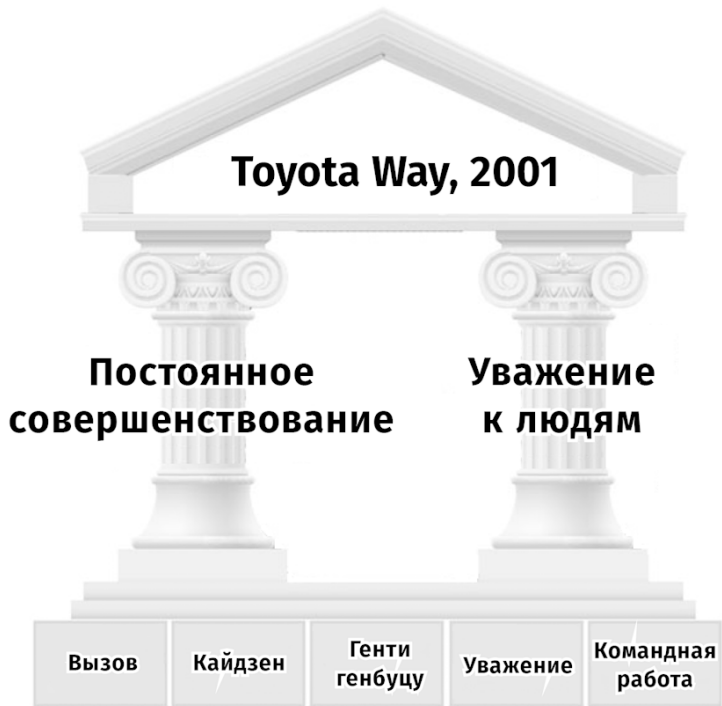
Рис 1.7. Toyota Way 2001 (Toyota Motor Company)

Философия была впервые описана Toyota в 2001 году, моя книга вышла в 2004-м. В документе Toyota Way версии 2001 (рис. 1.7) две колонны – постоянное совершенствование и уважение к людям. Эти колонны взаимосвязаны, и одна колонна не может существовать без другой. Постоянное совершенствование буквально означает, что мы все время совер-