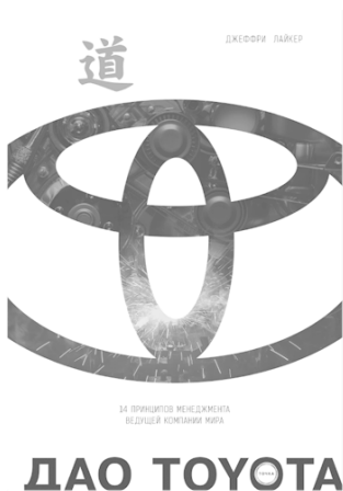
Рис 1.1. «Дао Toyota»

Главные вопросы, на которые хотели бы ответить в этой книге, – что такое бережливое лидерство и что необходимо для его развития? В качестве базовых знаний я кратко расскажу о производственной системе Toyota и модели 4P (4P Model), о которой подробнее вы можете узнать из книги «Дао Toyota». Это составит основу для понимания бережливого лидерства.