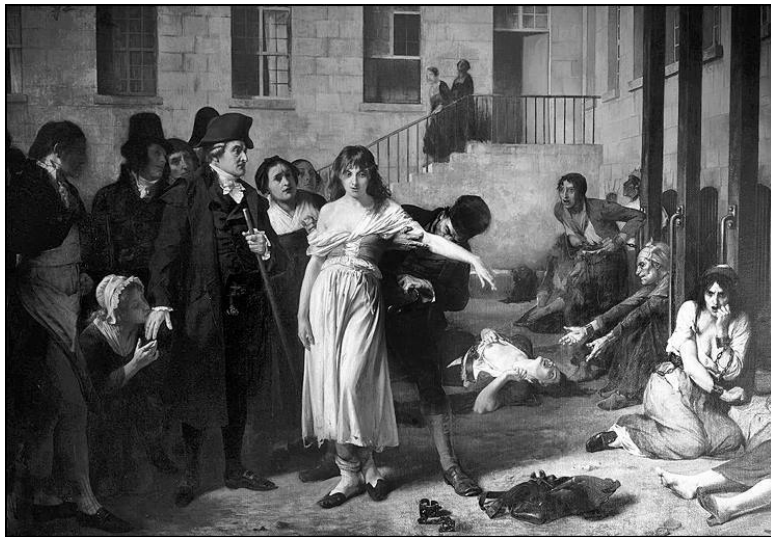
Филипп Пинель снимает цепи с больных Художник Тони Робер-Флери

Каждая глава рассматривает особую группу психических расстройств, особенности симптомов, течения и терапии заболевания. Структура глав построена так, что они разделены на две связанные части: художественную и медицинскую. Я очень надеюсь, что смогу показать читателю мир психиатрии изнутри, чтобы каждый смог через описание клинических случаев, изложенных в несколько художественной манере, посмотреть на болезнь тем же взглядом, что и врач-психиатр. Оговорюсь, что все представленные истории со-