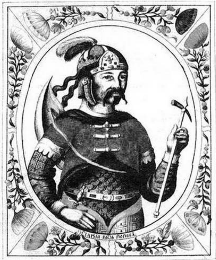
Рюрик в «Царском титулярнике». 1672 г.

Быстрая смена царей на московском престоле привела