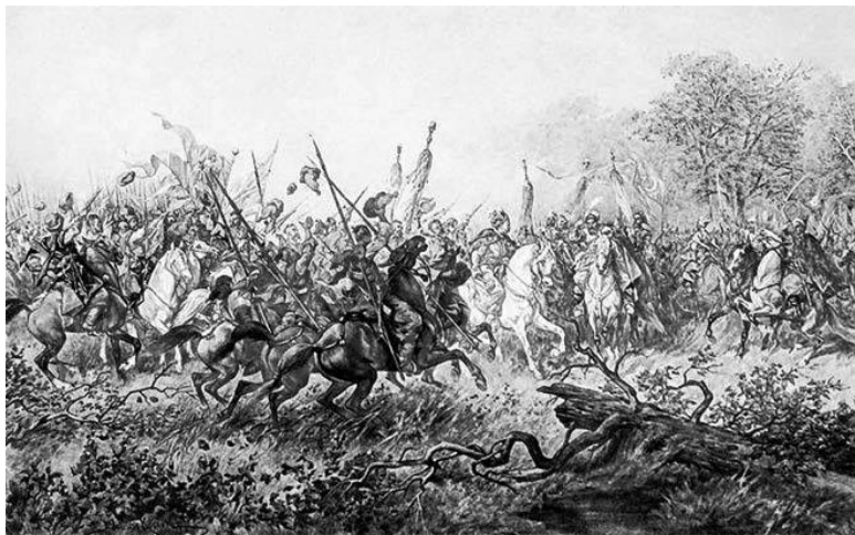
«Встреча Хмельницкого с Тугай-беем». Ю Коссак 1885 г

ного короля Яну Казимиру. Казаки отступили. По крайней мере, временно.