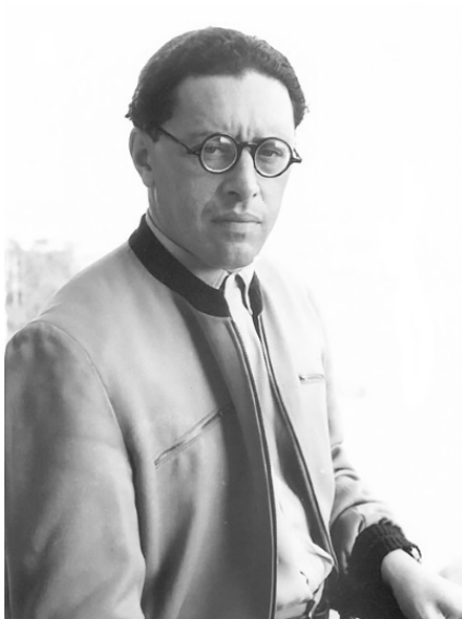
Юрий Трифонов. Москва, начало 1950-х гг.