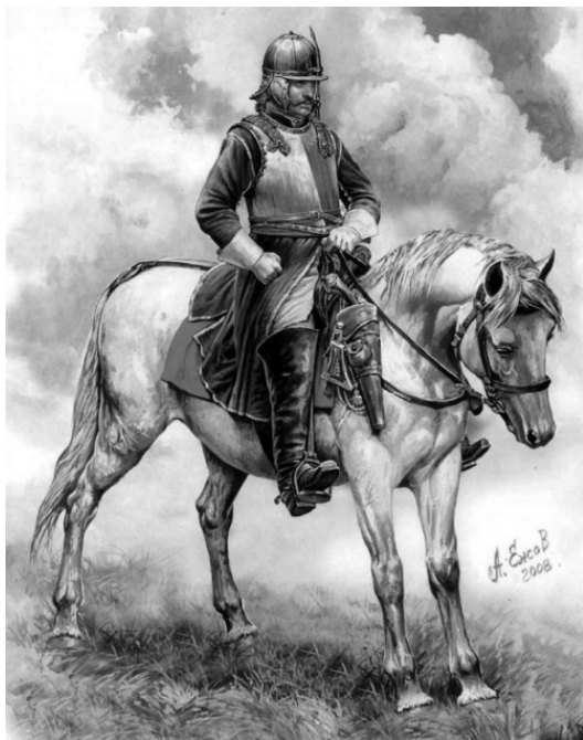
Русский рейтар второй половины XVII в.

Ротным командиром являлся «капитан» в пехоте и «рот-мистр» в кавалерии. Его помощником и заместителем был «поручик». В составе «начальных людей» роты был и еще один самый младший офицер – «прапорщик».