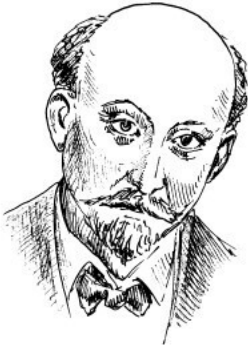
Рис. 7. Ф. Шейдеман

К 9 ноября революционная волна достигла столицы Германии. Промышленные предприятия были охвачены забастовками, рабочие и солдаты заполнили улицы Берлина, многотысячные демонстрации во главе с лидерами социал-демократов требовали немедленного отречения Вильгельма II. Под давлением общественности рейхсканцлер Гер-