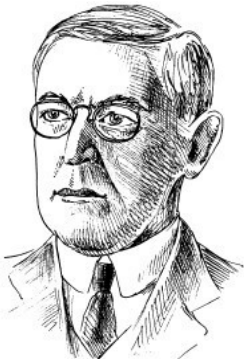
Рис. 8. В. Вильсон

новным политическим противником Англии как на европейском континенте, так и в колониях. В то же время интересы Британской империи настойчиво требовали ликвидации германского военного флота и передачи Великобритании большей части колониальных владений Германии.