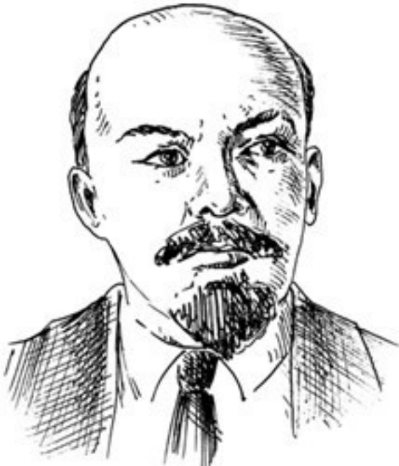
Рис. 2. В. И. Ленин

5 января 1918 г. начало работу созванное Учредительное собрание, к которому левое крыло социалистов тщательно подготовилось. На первом же заседании пробольшевистская часть левых эсеров и сами большевики в ответ на отказ собрания признать советскую власть демонстративно покинули зал заседания, в результате чего делегаты лишались возможности собрать кворум, но все же решили продолжить