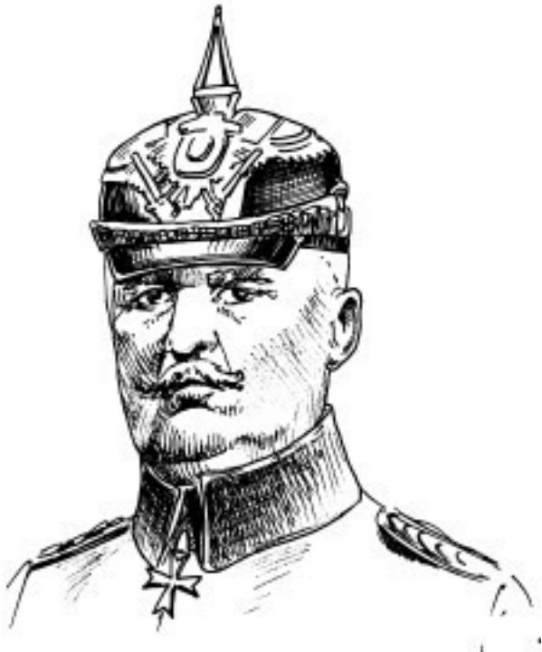
Рис. 4. Э. Людендорф

В сложившихся обстоятельствах начальник Генштаба генерал Эрих Людендорф (рис. 4) настойчиво советовал кайзеру Вильгельму II заключить перемирие с Антантой, а все высвободившиеся ресурсы направить на срочное реформирование внутриполитической структуры и объявить о формировании нового парламентского правительства.