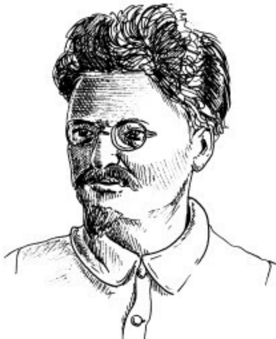
Рис. 3. Л. Д. Троцкий

завершить войну, а сам договор после грядущей германской революции утратит свой смысл.