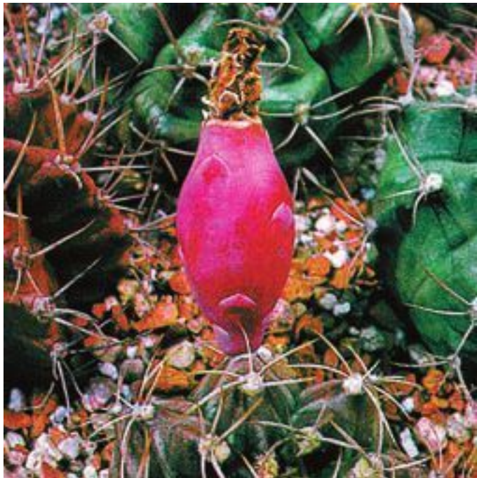
Gymnocalycium mihanovichii . Плод

Плоды кактусов, будь они размером с крупную сливу или с крошечную смородину, всегда бывают типичными ягодами: их мелкие семена вкраплены в мякоть, заключенную в кожицу. Размеры этих ягод, окраска, сочность, вкус, поверхность (гладкая или покрытая волосками и колючками) совершенно разные у кактусов различных групп. Да и все прочее в кактусах – корни, стебель, колючки, цветки и семена – отлича-