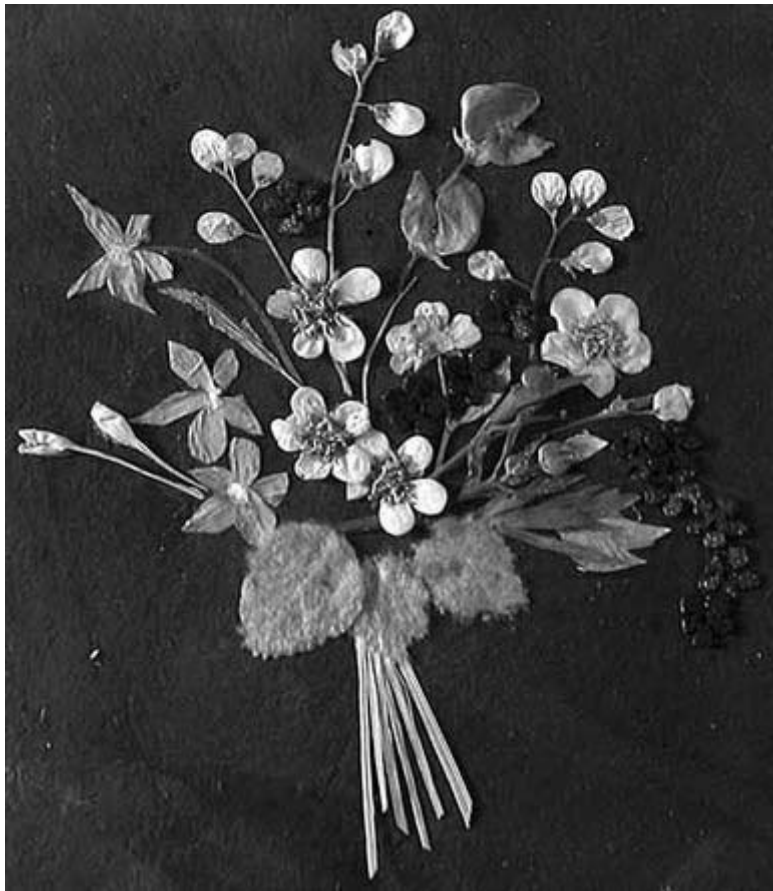
Рис. 1. Композиция из засушенных растений

Существуют разные способы составления композиций из сухих цветов. Высушенные растения просто ставят в вазу,