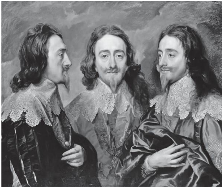
Ван Дейк, портрет Карла I, короля Англии, 1635–1636, холст, масло, Королевская коллекция.

Несмотря на одежду, которая способствовала ровному положению тела, правильная осанка активно прививалась. Среди женщин в России осанкой особо отличались воспитанницы института благородных девиц. Учениц Воспитательного общества благородных девиц при Смольном монастыре (позже Смольный институт) не просто обучали, а принужда-