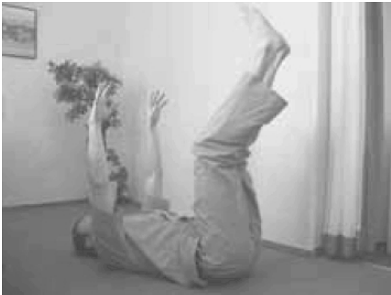
Рис. 2.8. Упражнение «жучок»

Хорошей профилактикой варикозного расширения вен нижних конечностей является велотренажер или велосипед.