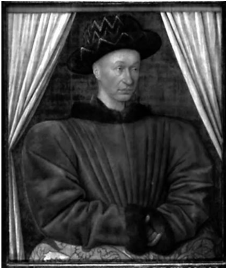
Портрет Карла VII, короля Франции. Художник Ж. Фуке