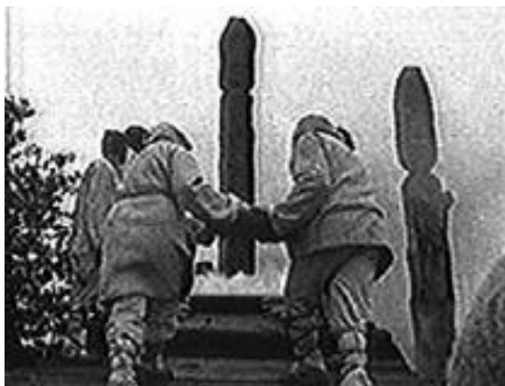
Принесение жертвы. Реконструкция (кадр из исторического документального фильма «Славяне», производство

Отсутствие источников приводит зачастую даже к отказу славянским богам в «праве на существование», а дошедшие до нас свидетельства о вере в них рассматриваются как поздние домыслы, эдакая «литературная игра» (см., напр., Ловмянский, 2003). Обратная сторона – стремление выдумать сонмище богов, следуя, видимо, принципу «чем больше – тем лучше», которой грешат многочисленные нынешние реконструкторы, мало знакомые как с историей и основной логикой развития мифа и мифологического мышления, так и с особенностями традиционного мировосприятия.