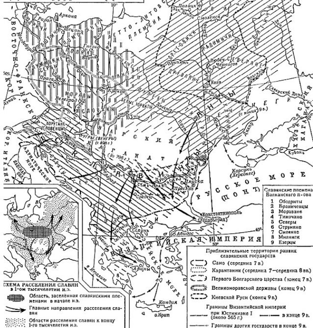
Расселение славян в VI-VIII вв. (по В. В. Седову)