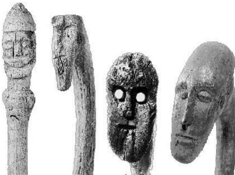
Деревянные домашние идолы IX-X вв. из раскопок в Новгороде

Древнерусской литературе присуще безымянное обличение тех, кто «во твар вероват, в солнце и в месяц, и во звезды, и инии ижи в море и в реки, и во источники, и в дерева польская, и во звери, и во огонь, и во иныя вещи различная». Богов «“нарицали” на земле, в воздухе, реках, ручьях, солнце и луне» – точнее, во всех природных стихиях... (Слово св. Кирилла о злых духах).