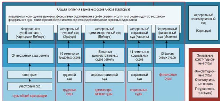
Рис. 3. Германия. Судебная система. Политический атлас.