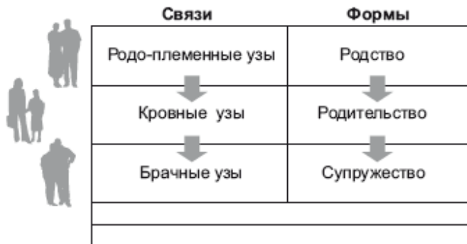
Рис. 1.1. Трансформация связующих и формообразующих основ брачно-семейных отношений

С психологической и этнографической точки зрения для семьи системообразующими являются брачно-семейные отношения.