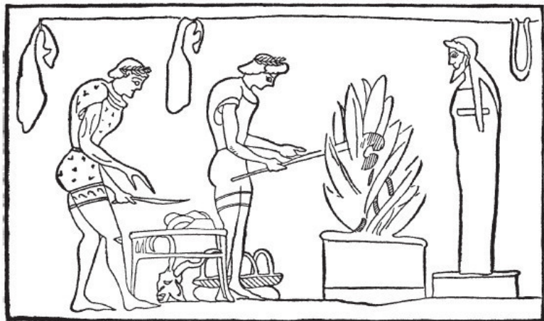
Рис. 2. Жертвоприношение