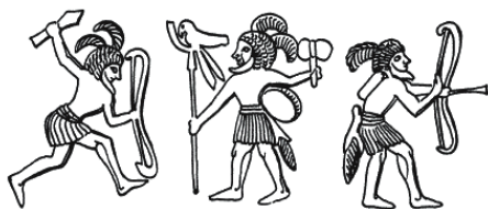
Рис. 4. Охотники додинастического периода

Крестьяне додинастической эпохи, которые жили в поселениях Верхнего и Нижнего Египта, постепенно достигли очень высокого уровня развития. Они были умными, изобретательными людьми, которые, собственно, и заложили основу будущего процветающего египетского государства (рис. 4).