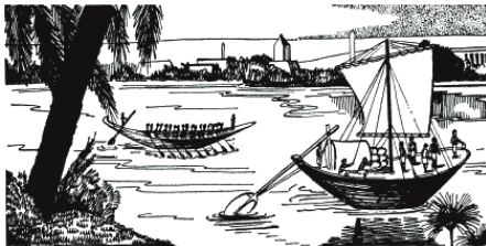
Рис. 2. Величайшая артерия Египта – река Нил

Древние египтяне были неотделимы от Нила. Они рождались, жили и умирали на берегах могучей реки, вид которой наполнял сердце любого человека, глядевшего на нее, благоговением и восторгом (рис. 2). Нил был не просто источником их существования, он сформировал их единое и сильное государство. Это была артерия, соединявшая каменистые возвышенности, располагавшиеся на юге страны, с изумрудно-зелеными землями дельты Нила, где река внезапно разветвлялась на тысячи мелких протоков перед впадением в море. Возвышенности (в нижней части карты) сначала назывались Верхним Египтом, в то время как дельта, граница которой начиналась в 10 милях вверх по течению от древнего Мемфиса, называлась Нижним Египтом. Два царства первоначально существовали как весьма свободные, но четко определенные конфедерации племен в течение более тысячи лет. Однако по мере неуклонного роста населения они неизбежно должны были рано или поздно объединиться, что и произошло немногим позже 3000 года до нашей эры, неза-