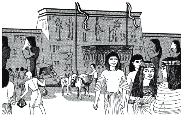
Рис. 8. Сценка из уличной жизни Тель-эль-Амарны

Если бы вы смогли побывать в Фивах, Мемфисе или Тель-эль-Амарне, вы бы оказались в веселом, бурлящем и очень деловом мире (рис. 8). Безусловно, вы увидели бы там памятники и башни – не такие обветшалые, как сейчас, а гладкие, блестящие и сияющие. И в те дни их можно было видеть только за окружавшими их оградениями или сквозь живой щит из листьев пальм и акаций.