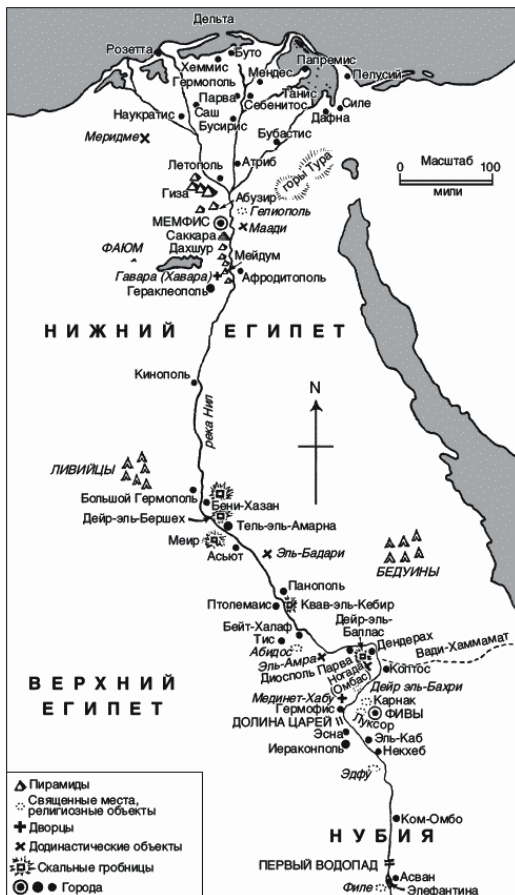
Рис 1. Карта Древнего Египта

Если вы посмотрите на карту Египта, вы увидите, что очертания этой страны напоминают распускающийся цветок