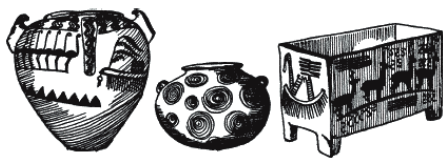
Рис. 7. Глиняные горшки и ящик 4-го тысячелетия до н. э.

На рис. 5 – 7 изображены предметы, которые древние египтяне доисторического и додинастического периода использовали в повседневной жизни. В частности, здесь показаны образцы прекрасно заточенных ножей, которыми они пользовались во время обрядов жертвоприношения; причудливо разрисованная глиняная посуда самых различных видов и стилей; изящные кувшины и вазы, сделанные из самых разных камней; личные украшения и оружие.