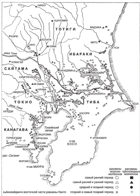
Карта 1. Кыёккемёдингги равнины Канто.

На современной карте раковинные кучи равнины Канто тянутся до Омии (префектура Ибараки) на севере, до Сано на северо-западе и примерно до Токородзавы на западе; они есть на полуостровах Босо и Миура, хотя на последнем их на удивление мало. Большие скопления этих куч находятся у озер Китаура и Касимигаура, вдоль притоков или участков старого русла Эдо, у реки Ара и ближе к заливу по бе-