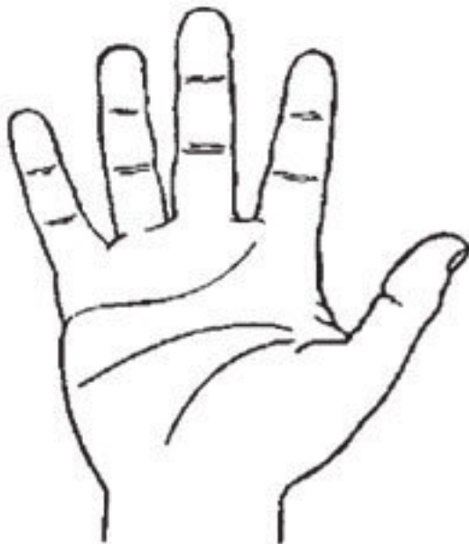
Рис. 10. Элементарная рука

Элементарная рука – крепкая, тяжелая, малоподвижная, с короткими, как бы притупленными пальцами, несколько отогнутыми назад (рис. 10). Большой палец невелик и неуклюж, а из-за неразвитой подвижности совершенно не гнется назад. Часто он весьма укорочен, неправильной формы и оканчивается почти у основания указательного. Ла-