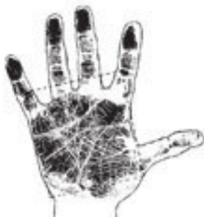
Рис. 2 Рис. 3

Рис. 2. Прагматическая ладонь: в основе ее – квадрат