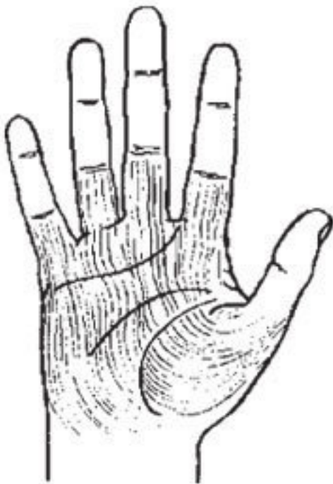
Рис. 6. Эмоциональная рука, или рука Воды Эмоциональная рука, или рука Воды (Рис. 6).

Характеристики руки Воды отражают глубинную суть этой стихии – неувовимостъ и изменчивостъ. Вода способна находиться в трех физических состояниях: жидком, твердом и газообразном, приближаясь тем самым к характеристикам остальных элементов. Внешние особенности хиротипа Воды следующие: