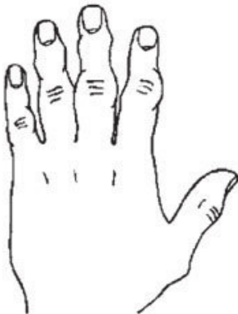
Рис. 8. Философская рука, или рука Дерева Философская рука, или рука Дерева (рис. 8).

У руки Дерева очень характерный вид: узловатые суставы пальцев и тонкие фаланги. Обычно на такой руке хорошо прорисован анатомический рельеф, иначе говоря, все вены, сухожилия и костные элементы имеют выпуклую форму.