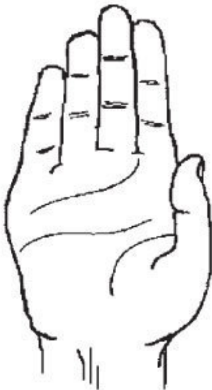
Рис. 11. Лопатообразная (лопатовидная) рука

Лопатообразная (лопатовидная) рука (рис. 11) характеризуется тем, что первые (ногтевые) фаланги пальцев рас-