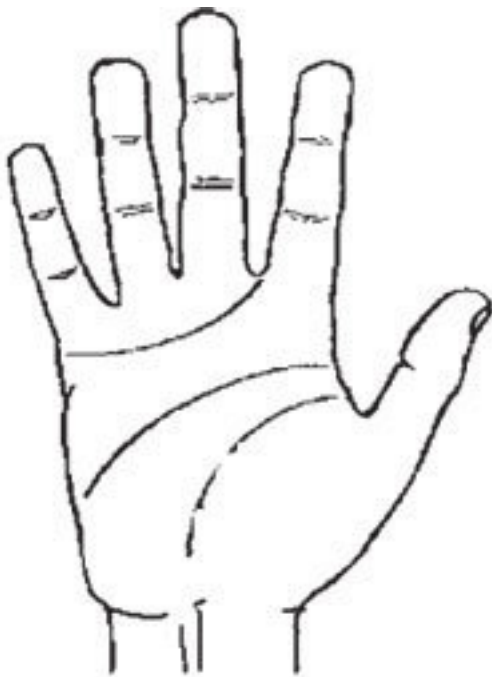
Рис. 12. Квадратная рука

Квадратная (угловатая) рука (рис. 12) характеризуется ладонью квадратной формы, которая при этом несколько вогнута и довольно твердая на ощупь. Запястье крепкое и широкое. Кончики и основания пальцев прямоугольные, а суставы – хорошо развитые, узловатые. Сами пальцы очень жесткие, почти не гнущиеся; ногти также имеют квадратную