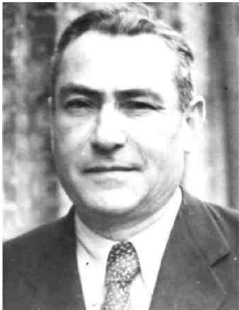
МОЙ ДОБРЫЙ ПАПА