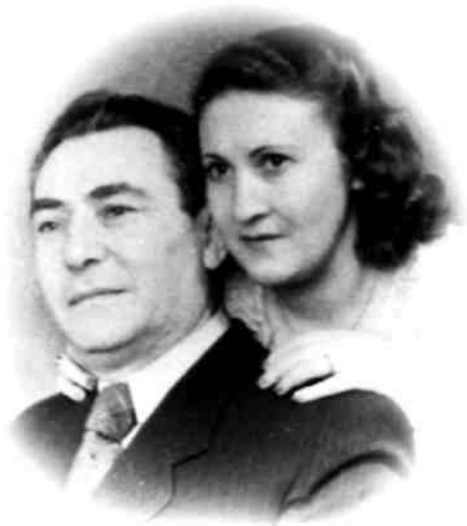
ОНИ БЫЛИ КРАСИВОЙ ПАРОЙ

– Я уверен: у тебя будут другие женщины, я могу это понять. Но я тебе не прощу, если об этом узнает Майя – своих жён нельзя огорчать, особенно, таких любящих, как она. Запомни!