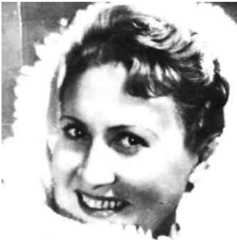
МОЯ КРАСИВАЯ МАМА

– Неважно! Я начну работать, и всё окупится.