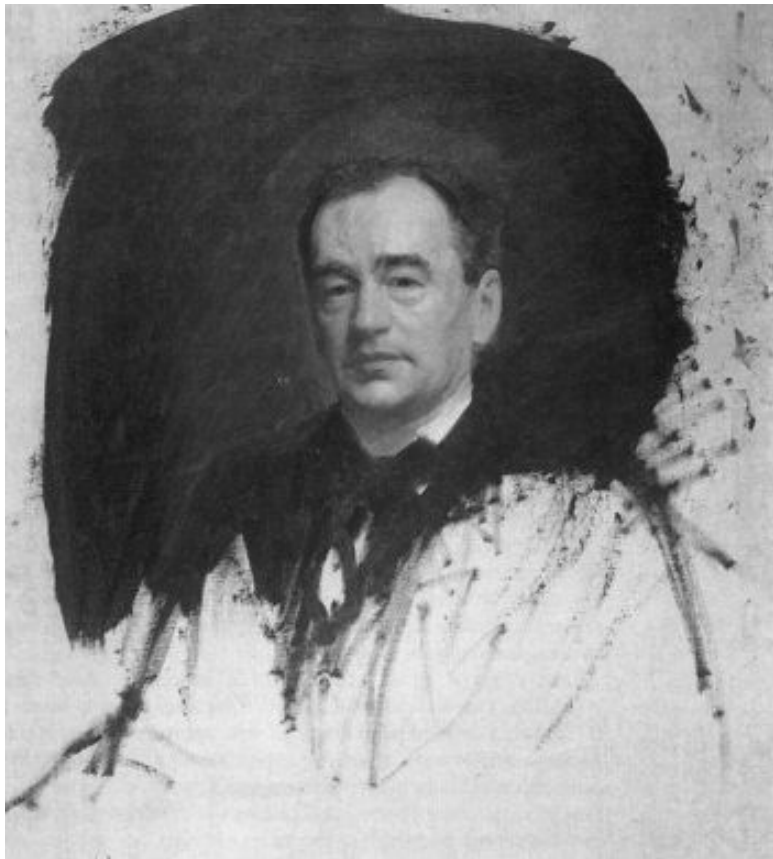
И.Н. Крамской. Портрет доктора К.А. Раухфуса. 1887 г.

В августе 1896 г. должность врача при детях Николая II занял почетный лейб-педиатр доктор И.П. Коровин. До это-