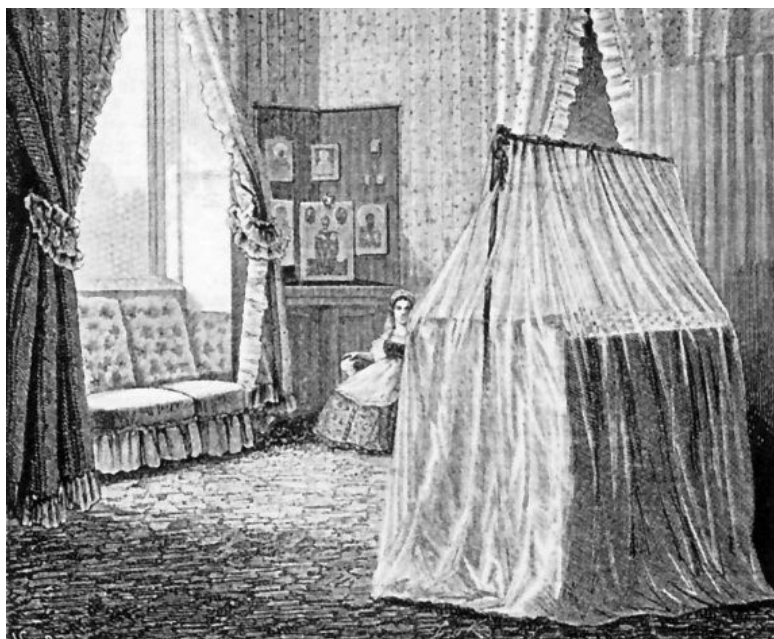
Спальня Ники в Аничковом дворце

Когда в России, начале 1840-х гг. ассигнации пересчитали на серебро, то пересчитали и деньги дочерей «умершей кормилицы». Анна и Авдотья стали «за поздравления» получать 14 руб. 28 \frac{4}{7} коп. на двоих.