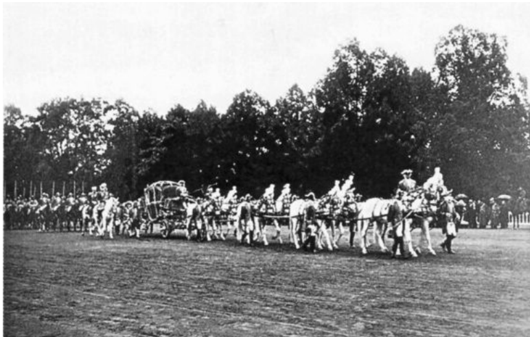
Кортеж в день крещения цесаревича Алексея 11 августа 1904 г. Шествие к Нижней даче от Большого Петергофского дворца

Когда в 1840-х гг. начали появляться дети у будущего Александра II, обряд их крещения повторился до деталей. Первая дочь Александра II родилась 19 августа 1842 г. 30 августа состоялся обряд ее крещения в церкви Большого Екатерининского дворца Царского Села. Нести новорожденного по статусу полагалось первой придворной даме, которой тогда была статс-дама княгиня Е.В. Салтыкова. Согласно требованиям церемониала, на ней было «русское» придворное