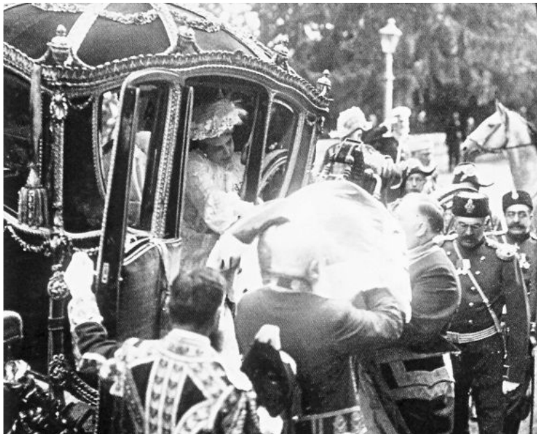
День крещения цесаревича Алексея 11 августа 1904 г. Прибытие новорожденного