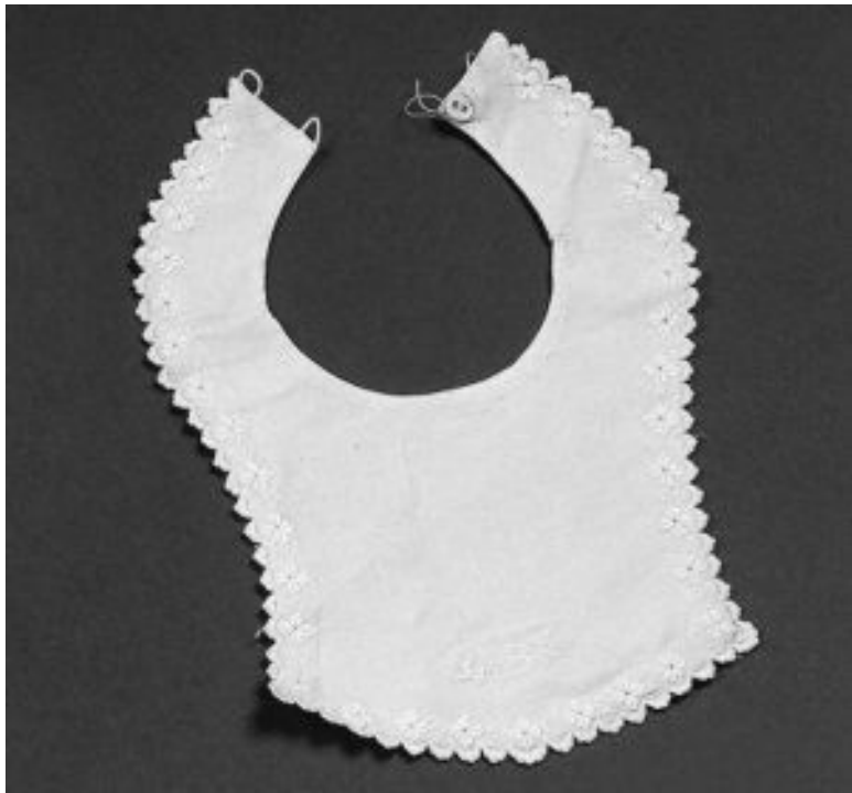
Нагрудники детские. 1900-е гг.

При рождении Михаила, последнего сына Павла I, эта традиция была ликвидирована. «Повседневный» вариант предполагал роскошный русский традиционный сарафан с кокошником. Эта «форма» соблюдалась при Дворе вплоть до 1917 г. Поскольку «русские» сарафаны были дорогими и ши-