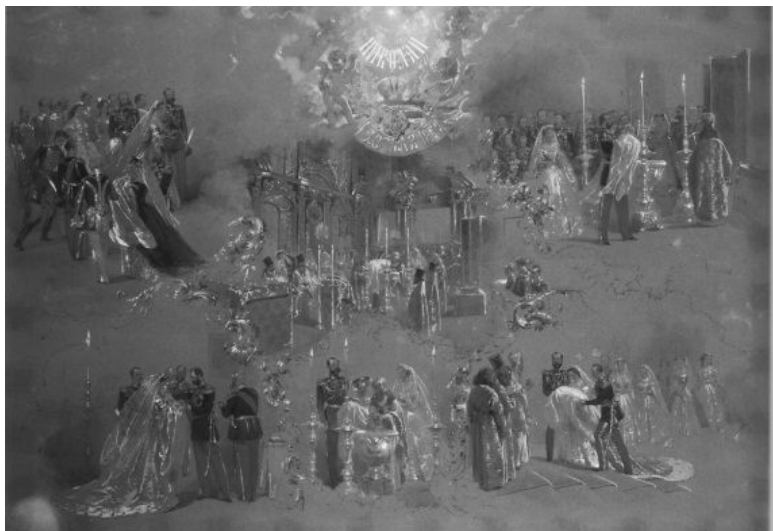
М. Зичи. Крещение вел. кн. Николая Александровича. 1868 г.