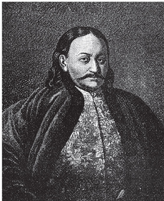
Портрет Ф. Ю. Ромодановского.