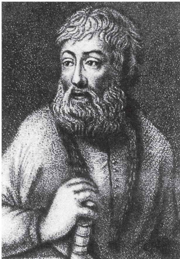
Портрет дьяка Н. М. Зотова. Гравюра.