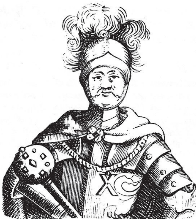
И. С. Мазепа. С аллегорического портрета дьякона Мишуры. Нач. XVIII в.