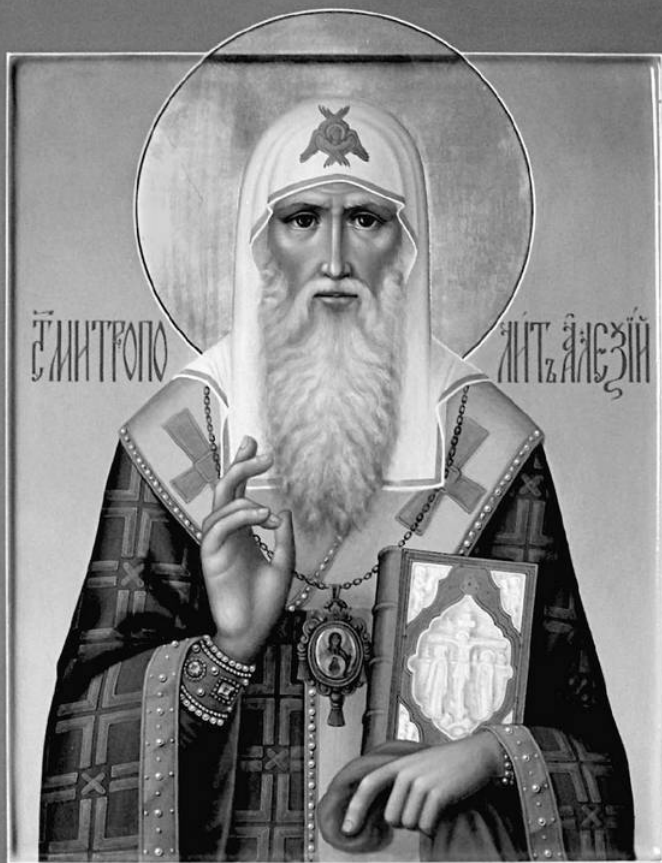
Св. Алексий митрополит Московский и всея России