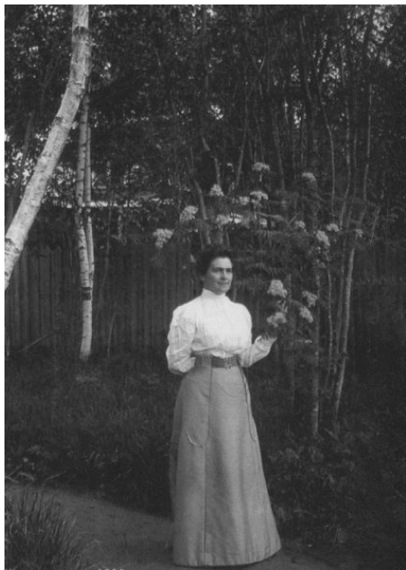
Ольга Книппер-Чехова на даче, лето 1911 г.

шампанского. Чехов взял бокал, улыбнулся Ольге Леонардовне и сказал: «Давно я не пил шампанского». Выпил все до дна, лег на бок – и только она успела перебежать и нагнуться к нему, – он уже не дышал.