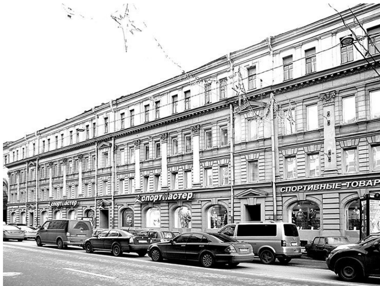
Московский проспект, 10–12, центральная часть. Фото 2013 г.