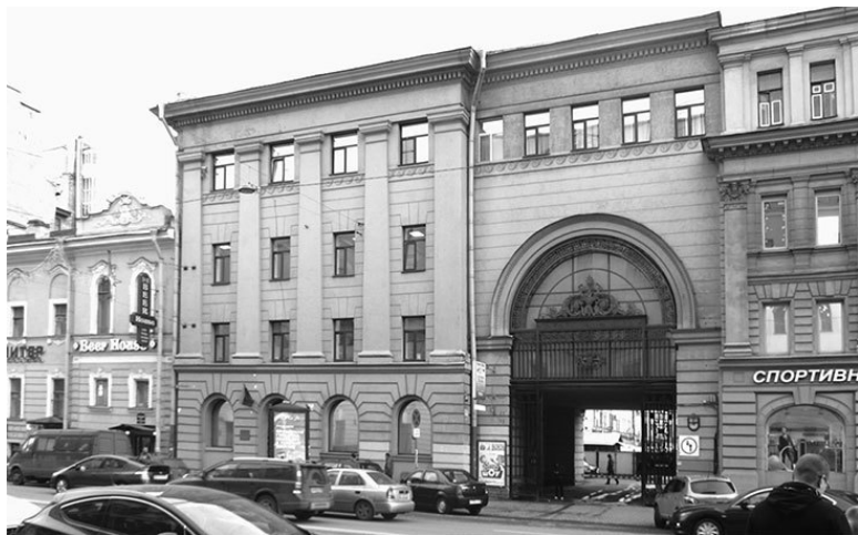
Московский проспект, 10–12, левая часть. Фото 2013 г.

Нижний торговый этаж всех секций выделен рустовкой и полуциркульными оконными проемами, одиночными в боковых и сдвоенными в центральной секции. Прямоугольные оконные проемы верхних этажей разделены плоскими пилястрами коринфского ордера (на крайних секциях капители упрощены при надстройке здания). Входы в торговые помещения центральной секции и окно третьего этажа над ними украшены треугольными сандриками. Впечатляют арочные въезды во двор, расположенные между центральной и боковыми секциями, украшенные решетками художественного литья.