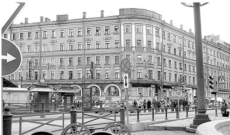
Московский проспект, 2 / Сенная площадь, 6. Фото 2013 г.