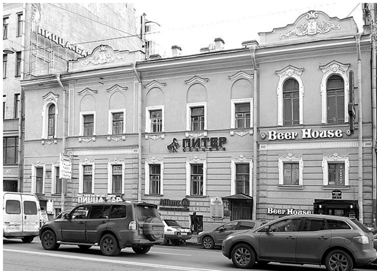
Московский проспект, 8. Фото 2013 г.