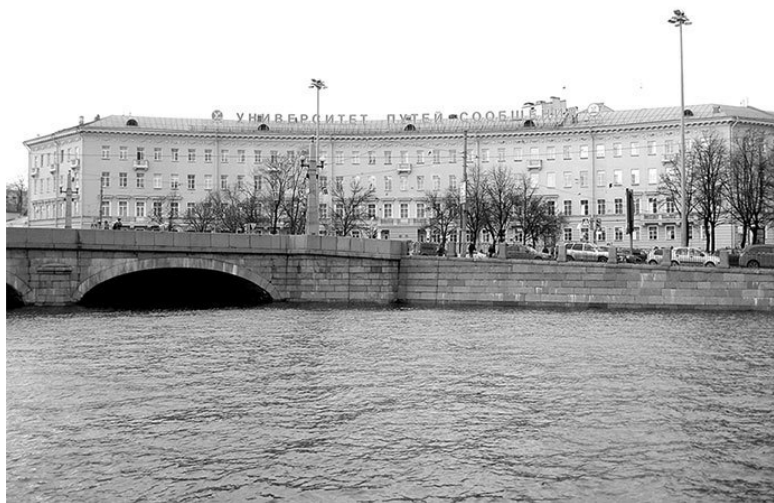
Московский проспект, 13–15. Фото 2013 г.