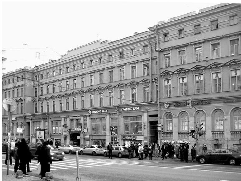
Московский проспект, 7. Фото 2013 г.