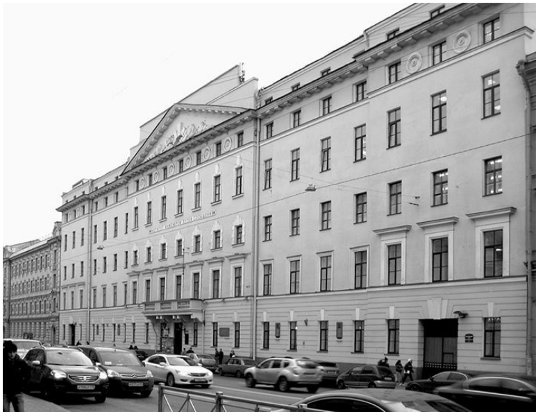
Московский проспект, 9. Фото 2013 г.

В 1876 г. гражданский инженер Д. Д. Соколов перестроил здание химической лаборатории, числящееся по этому адресу.