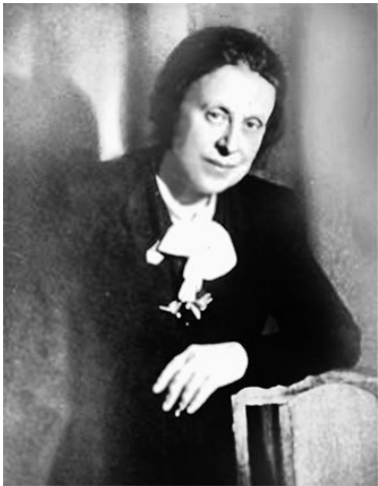
Ю. М. Гефтер