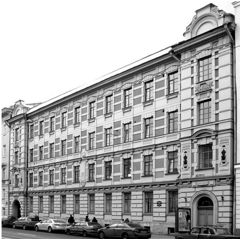
Московский проспект, 11. Фото 2013 г.

«Табачная» история бывшего участка Жукова на Обуховском, теперь уже Забалканском, проспекте связана с именем другого табачного фабриканта.