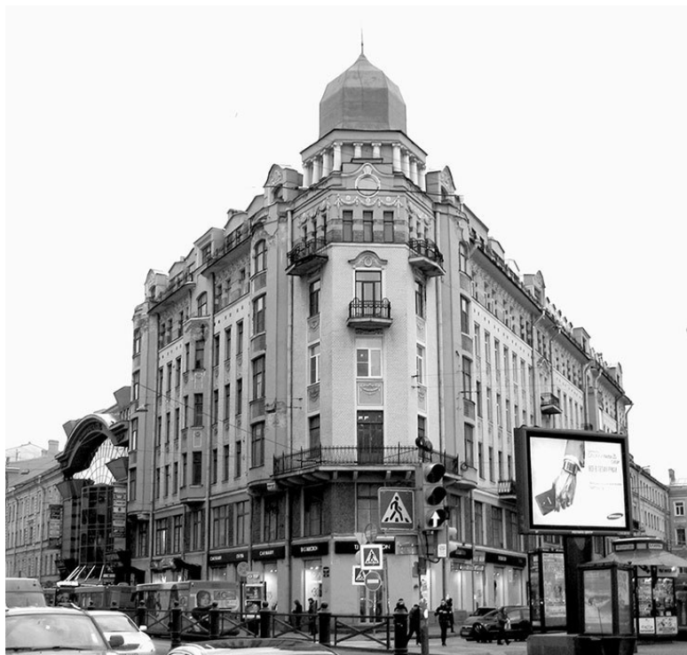
Московский проспект, 1. Фото 2013 г.