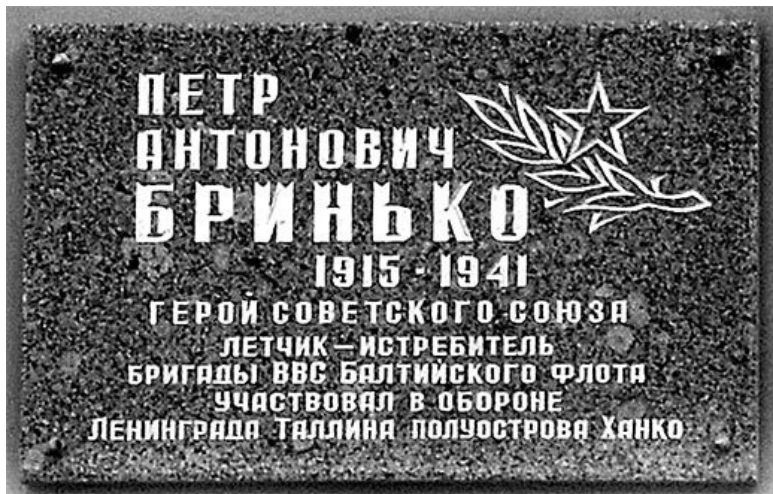
Мемориальная доска П. А. Бринько

К 300-летию Санкт-Петербурга на доме была воссоздана угловая башня. Однако в ней «забыли» сделать в нижнем поясе овальные окна-люкарны, без которых купол напоминает глухой колпак.