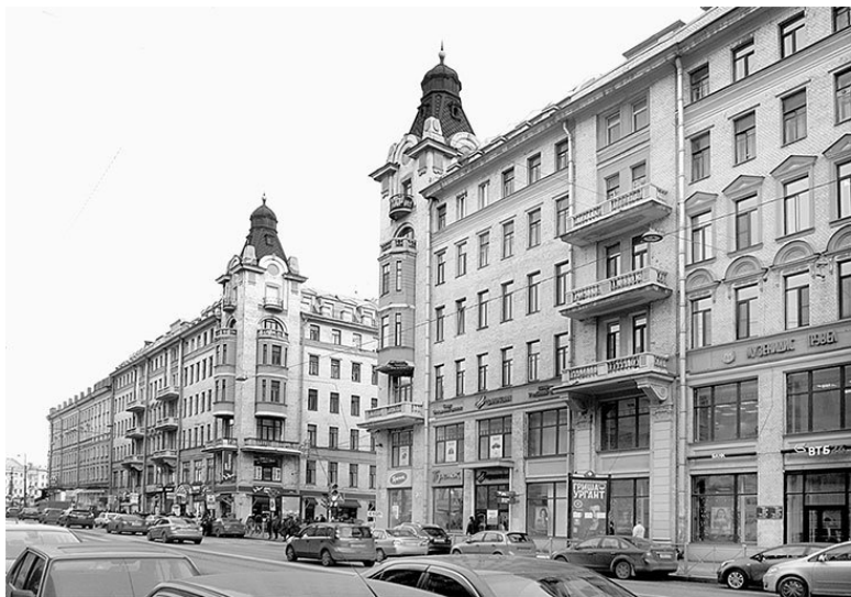
Московский проспект, 4, 6. Фото 2013 г.

Сегодня с трудом можно представить размеры этой городской трущобы. В немыслимом лабиринте домов, бараков, сооружений иной пришелец не отважился появиться не только в вечерние часы, но и днем. В «лавре» были бани, рынок подержанных вещей, трактир, где Достоевский «устроил» встречу Раскольникова со Свидригайловым: Раскольников «находился на – ском проспекте, шагах в тридцати или в сорока от Сенной, которую прошел. Весь второй этаж дома налево был занят трактиром. Все окна были отворены настежь, трактир, судя по двигавшимся фигурам в окнах, был