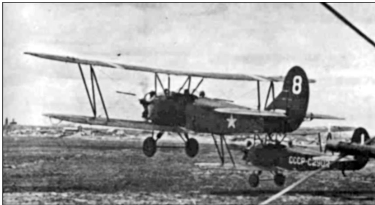
У-2 в полете