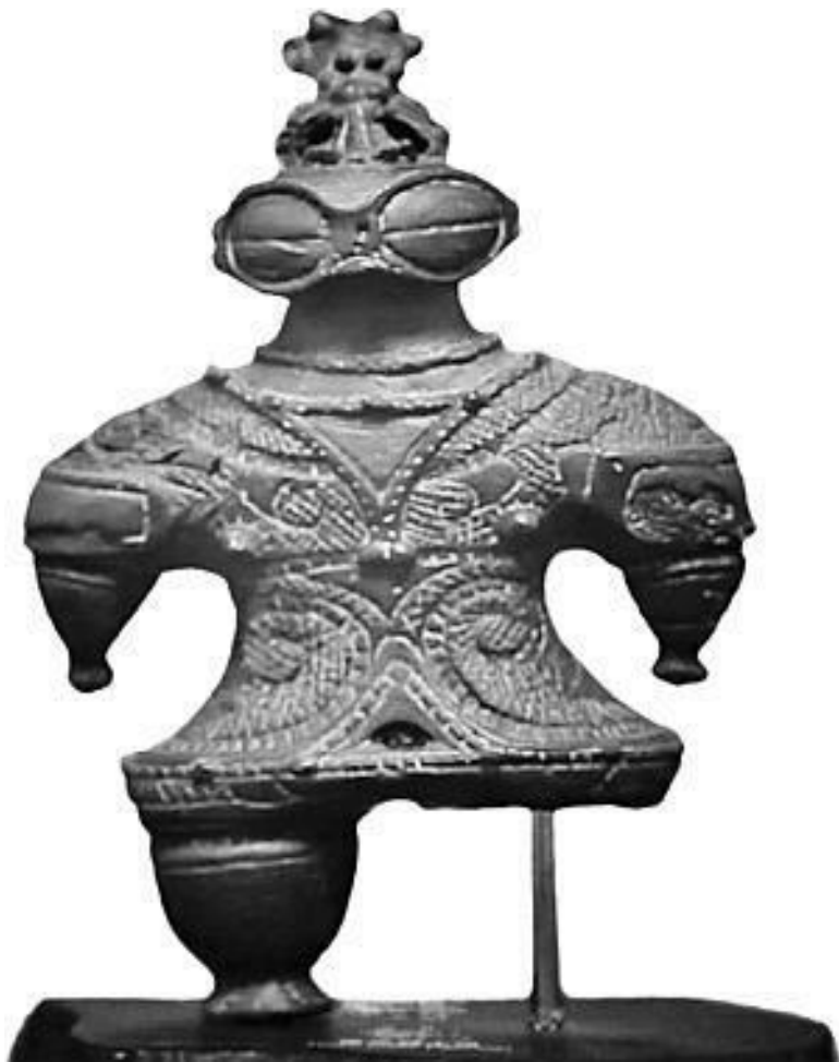
Статуэтка «догу», Музей Гиме, Париж