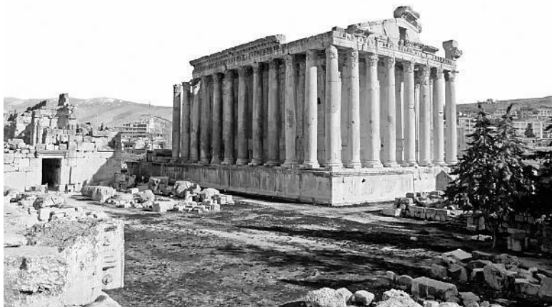
Храм Вакха (Меркурия) в Баальбеке, Ливан