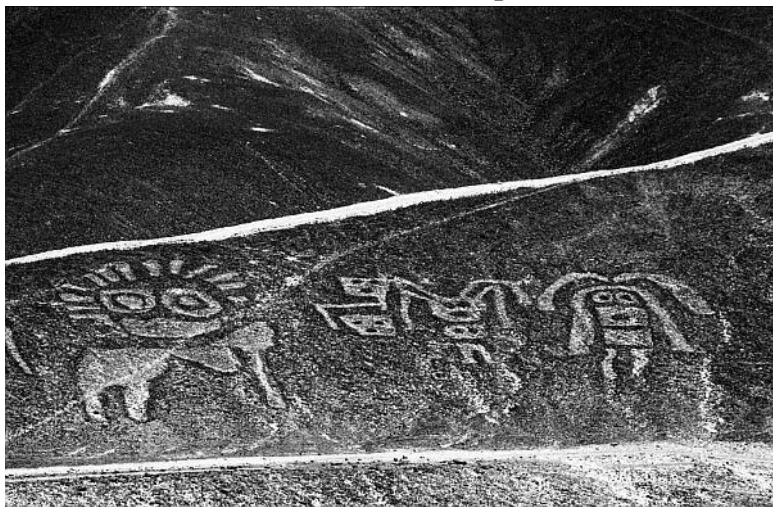
Рисунки-геоглифы, плато Пальпа