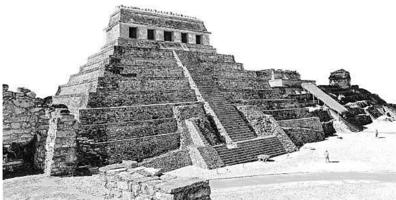
Гробница Пакаля, Паленке, Мексика

тым орнаментом, повергла историков в шок. Потому что на рисунке ясно видно не что иное, как фигура пристегнутого к креслу вполне современного пилота в скафандре. На нем как будто дыхательный аппарат, рядом – пульт управления, а позади сопло с реактивными струями. Но разве могли древние индейцы, которые даже не знали, что такое колесо, придумать такое много сотен лет назад?