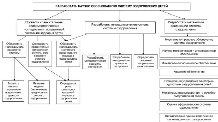
Рис. 2. Дерево взаимосвязей в методике проектирования системы оздоровлен

ке проектирования системы оздоровления детей задействованы три звена композиционной цепочки дерева взаимосвязей: цель, этапы, задачи (рис. 2).