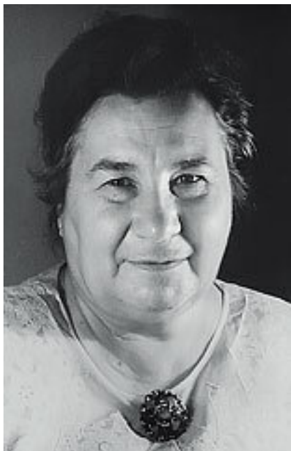
Любовь Воронкова (1906–1976)