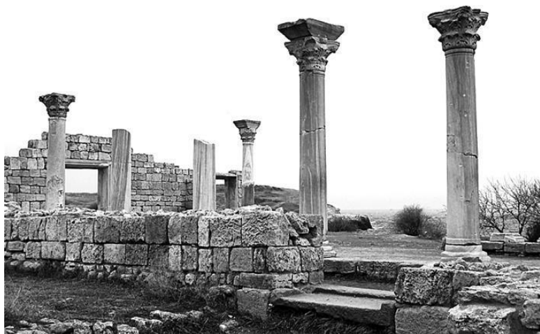
Руины древнего города Херсонеса Таврического в Севастополе

ство построек, выводы напрашиваются сами собой: город процветал. Он даже сейчас поражает своим размахом и величием и привлекает массу туристов, желающих прикоснуться к древности.