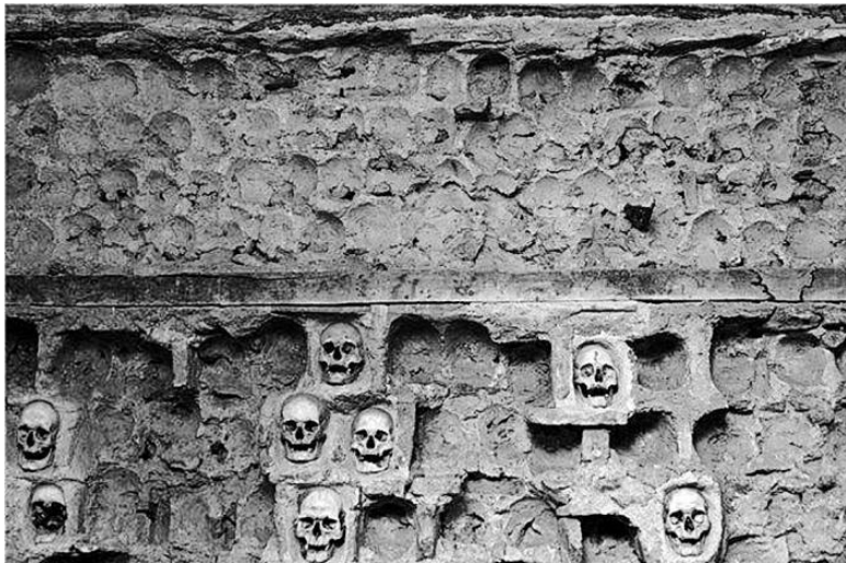
Стена башии Челе-Кула

Но российского заступничества за сербский народ Европа не поняла. К примеру, небезызвестный Фридрих Энгельс тогда написал: «Россия хочет захватить Константинополь, чтобы потом двинуться со своими ордами дальше в Европу». А британский статс-секретарь по иностранным делам лорд Кларендон заявил: «Пора начать битву цивилизации против варварства». И битва началась – против России выступили самые мощные европейские державы – Англия и Франция, к ним присоединилась Сардиния, а позже – Австро-Венгрия. Только представьте, почти весь современный Евросоюз!