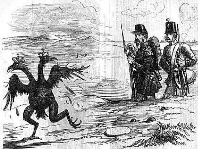
THE SPLIT CROW IN THE CRIMEA.