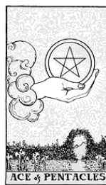
Туз Монет/ Пентаклей