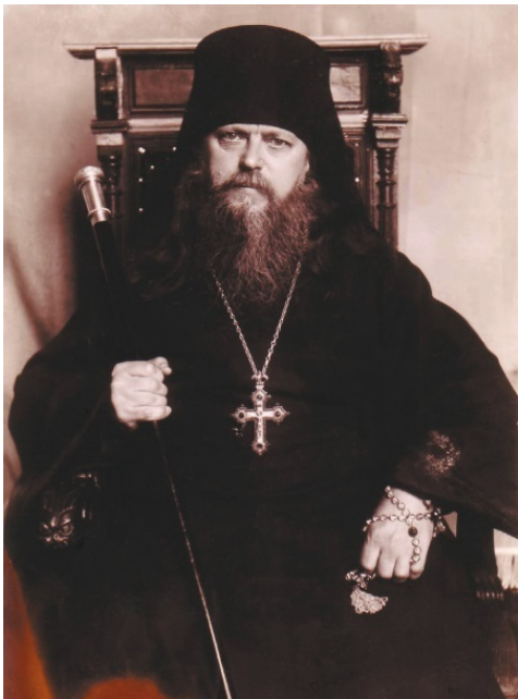
Архимандрит Исаакий (Виноградов; 1895–1981)