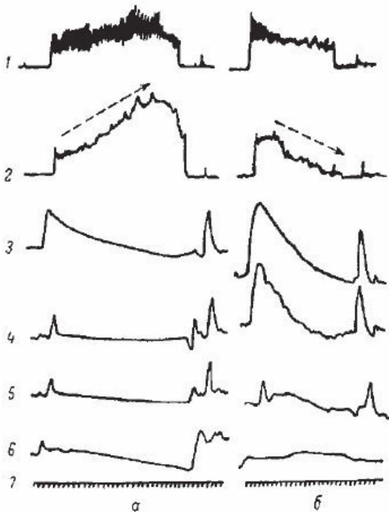
Рис. 3. Пневмографические записи дыхательных движе-