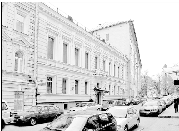
Дегтярный переулок, дом № 6

В 1820-х гг. на территории усадьбы некий Лехнер снимал помещение для своего пансиона, и у него поселился великий польский поэт Адам Мицкевич, высланный русским правительством из своей родной страны. Он приехал в Москву 24 декабря 1825 г. и поселился в этом пансионе, в котором жили и «имели общий стол, комнату и услуги» его польские друзья.