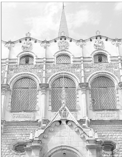
Здание Российской ссудной казны. Архитектор В.А. Покровский. 1913–1916 гг.

ла деньги под заклад золота, серебра, платины и драгоценных камней, а также других ценных вещей, кроме процентных бумаг, одежды и «обыкновенной мебели».