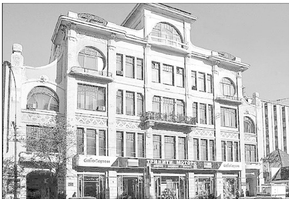
Дом Сытина, Тверская улица, дом № 18

ситета», он же составил грамматику русского языка, которая была основным учебником нескольких поколений учащихся. Барсов имел большую библиотеку и собрание старинных рукописей.