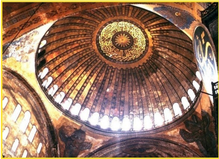
Фото храма в Софии

В этой экспозиции повсюду отображены символы единения Солнца с Луной, словно брата и сестры. А всё потому, что после первого апокалиптического низвержения солнечных индивидов, три богини из этого числа зацепились за лунный магнетизм. Вернуться обратно на слабеющую звезду уже не представлялось возможным и они объединились в защитный тройственный союз, создав на светлой стороне Луны свой маленький божественный мирок. В профилях ниже я называю это божественное объединение «Лунный Триумвират». Те из вас, кто знаком с книгой пророка