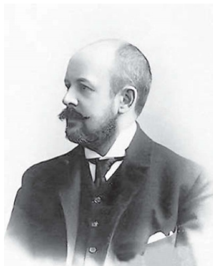
А. П. Извольский

Вена почти ультимативно требует от Порты концессии на прокладку Новобазарской железной дороги и вместе с тем предлагает подписать двустороннюю военную конвенцию относительно вилайетов Солунского, Янинского, Шкодрского, Битольского и Косовского при сохранении политического суверенитета в них 45 . Официальным концом Мюрцштегской программы можно считать май 1909 г., когда Порта запросила согласие держав на уничтожение международной финансовой комиссии; 24 августа 1909 г. (уже после Боснийского кризиса) она была упразднена 46 .