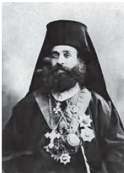
Митрополит Герман Каравангелис

Аналогичным образом действовала греческая сторона, сочетая пропаганду национальной идеологии через школьное дело и просветительские общества с вооруженной борьбой партизанских отрядов. Для греков борьба за Македонию была важнейшей составной частью осуществления великой идеи – объединения всех исторических греческих земель в одно государство и восстановления Византийской империи. В 1894 г. в Греции была создана патриотическая организация ЕЭλλκ] етацта (Национальное общество), целью которой было укрепление эллинизма в греческих областях, находящихся под турецким владычеством. Первоначально она была ориентирована на Крит, но начиная с 1896–1897 гг. стала посылать отряды в Македонию. В состав общества входили многие известные деятели того времени