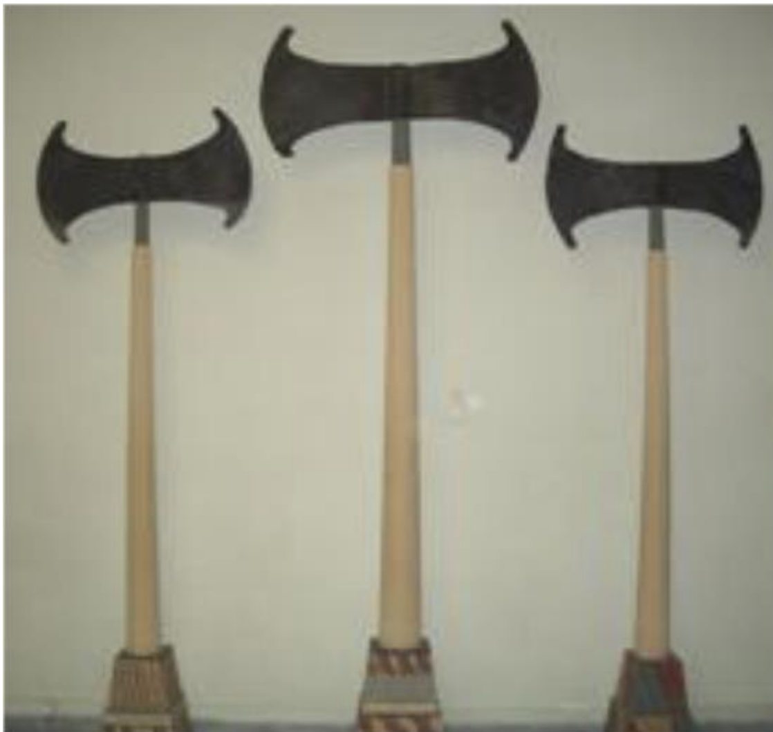
Рис. 11. Лабрисы

почитание которой было широко распространено в странах Средиземноморья, начиная с эпохи неолита. Другой образ – это образ могучего и свирепого бога-быка. Определенную роль играли священные символы вроде бычьих рогов или двойного топора – лабриса. В религии минойского периода тесно переплелось «божеского и человеческого», что было ее отличием от позднейшего времени.