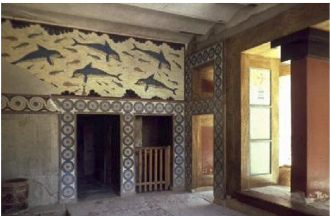
Рис. 10. Интерьер дворца в Кноссе

Жизнь критян осложняли природные катаклизмы. Землетрясения, частые в этих местах морские штормы, сопровождающиеся грозами и ливневыми дождями, засушливые годы – все это периодически обрушивалось на Крит. Защитой жителям служили боги. Центральной фигурой минойского пантеона была великая богиня – «владычица». Так именуют ее надписи, найденные в Кноссе и в некоторых других местах. В этом разноликом образе угадываются общие черты древнего божества плодородия – великой матери всех людей, животных и растений,