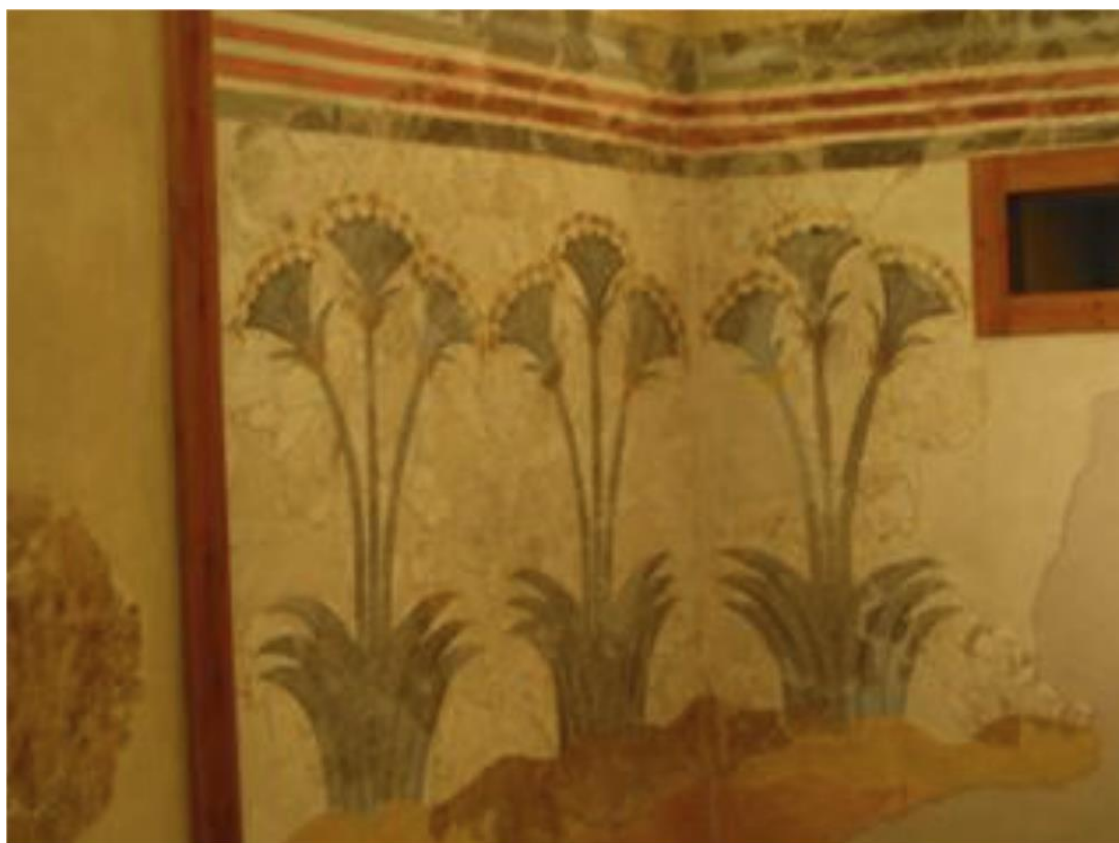
Рис. 4. Росписи стен Кноссского дворца

Эпоха дворцовой цивилизации на Крите охватывает в общей сложности около 600 лет (2000 – 1400 гг. до н. э.). Археологам известны несколько больших дворцов, вокруг которых группировались небольшие общинные поселения. Это дворцы Кносса, Феста, Маллии в центральной части Крита и дворец Като Закро (Закрое) на восточном побережье острова. Отличали эти крупные постройки вытянутость по осевой линии всегда в одном и том же направлении: с севера на юг. Посуда дворцов в стиле Камарес поражает ученых цветом богатством росписей и динамизмом, безостановочным движением, который создает орнамент. Эта черта станет в дальнейшем важнейшим отличительным признаком всего минойского искусства. В эту эпоху на Крите создается линейное письмо А.