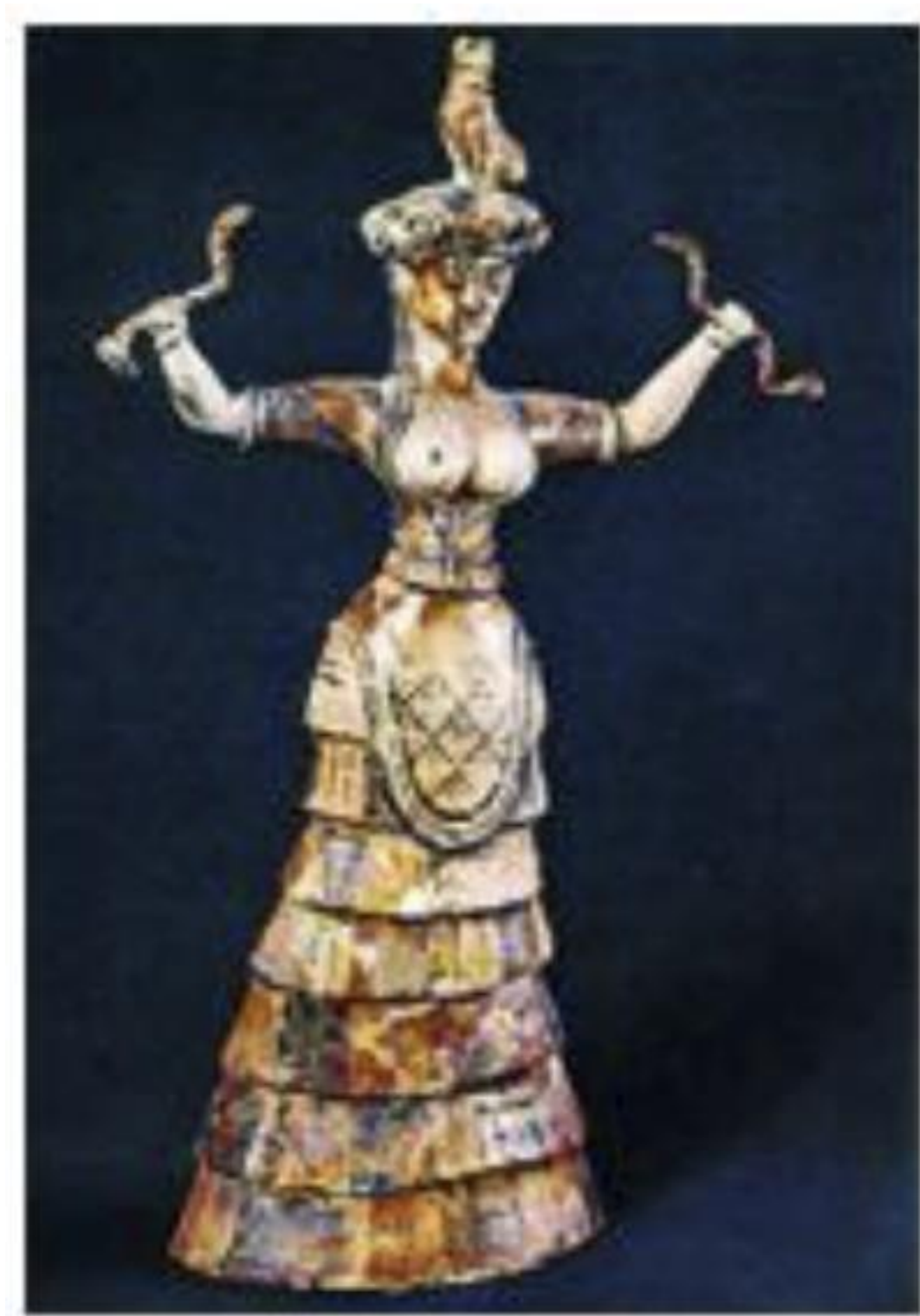
Рис. 12. Великая Богиня

Как считают многие ученые, на Крите существовала особая форма царской власти, известная в науке под именем «теократии» (одна из разновидностей монархии, при которой светская и духовная власть принадлежат одному и тому же лицу). Особа царя считалась «священной и неприкосновенной». Даже лицезрение его было запрещено «простым смертным».