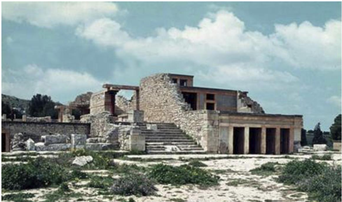
Рис. 9. Внешний вид дворца в Кноссе