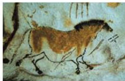
Рис. 1. Пещера Альтамира

Второй вид первобытного искусства – произведения из рога, кости и камня. Это – малые формы и первое появление декоративного искусства. Например, женские фигурки высотой от 12 до 25 см из бивня мамонта, найденные на территории Франции, Италии, Австрии и др.