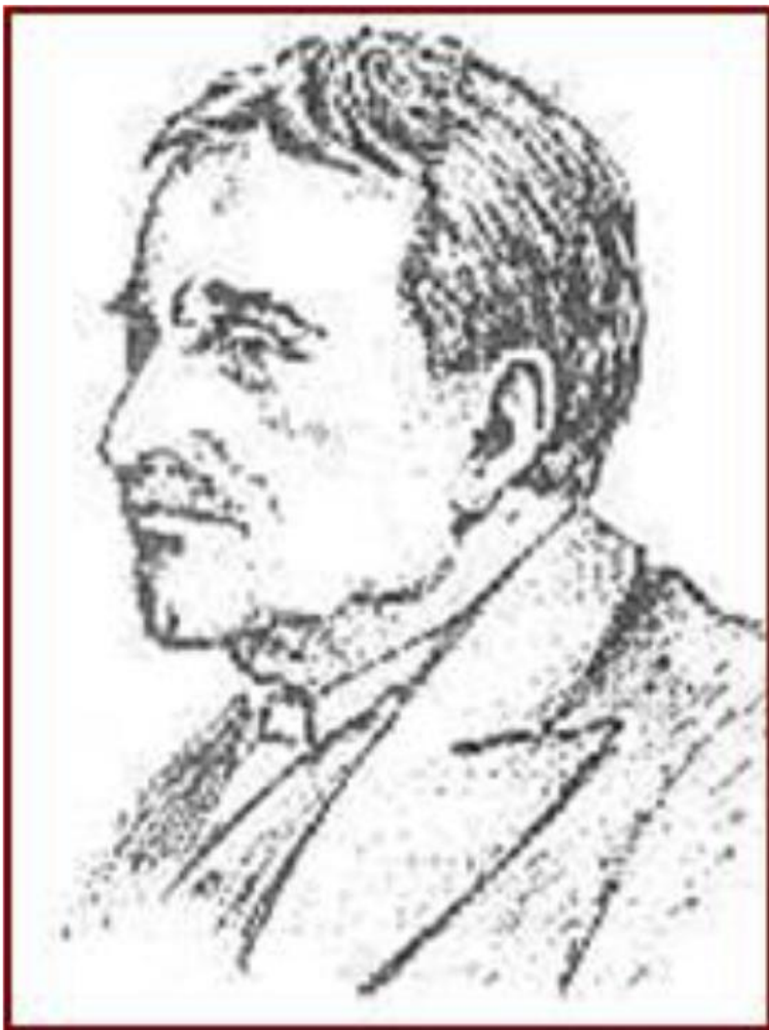
Рис. 5. А. Эванс

Примерно около 1700 г. до н. э. дворцы Кносса, Феста, Маллии и Като Закро были разрушены, по всей видимости, в результате сильного землетрясения, сопровождавшегося большим пожаром. Новые постройки стали еще более великолепными. Археолог А. Эванс (1851 — 1941 гг.) открыл так называемый дворец Миноса в Кноссе, комплекс зданий которого состоял из 300 помещений общей площадью 16000 кв. м.