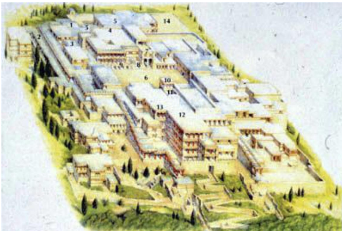
Рис. 6. Реконструкция Кносского дворца

Архитектура этого критского дворца, как и других, была в высшей степени необычна, своеобразна и ни на что не похожа. Здесь имелись водопровод и канализация, хорошо продуманная система вентиляции и освещения. Стены дворца в Кноссе украшали великолепные безмятежные и жизнерадостные фрески, отличавшиеся разнообразной цветовой гаммой и исключительным искусством в передаче движения людей и животных. Они не содержали жестоких кровавых сцен войны и охоты, столь популярных в современном им искусстве стран Ближнего Востока и материковой Греции. Археологов поразили факт отсутствия укреплений дворцов, его обитатели чувствовали себя в полной безопасности. Ни одной значительной морской державы рядом тогда не существовало.