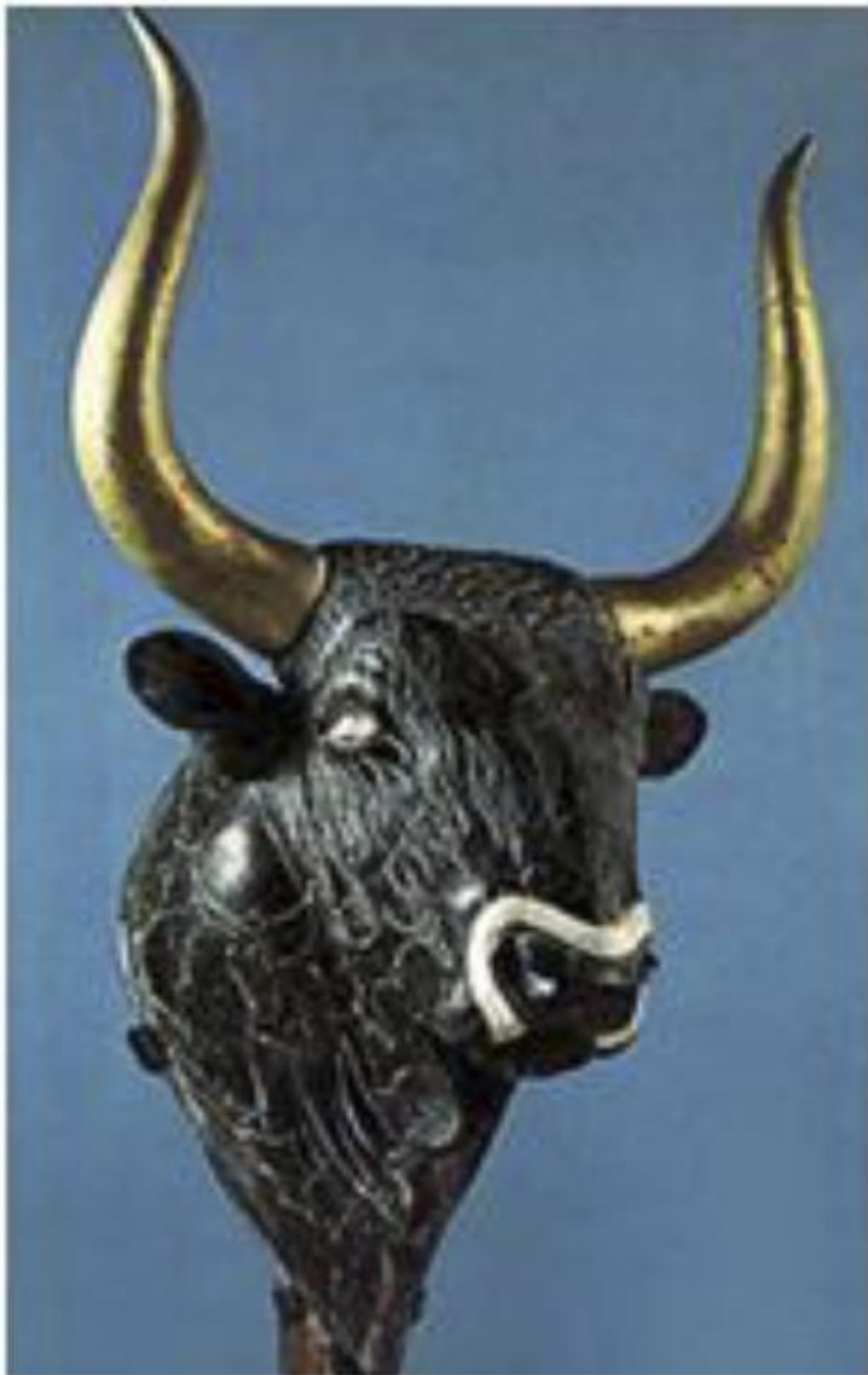
Рис. 8. Священный бык