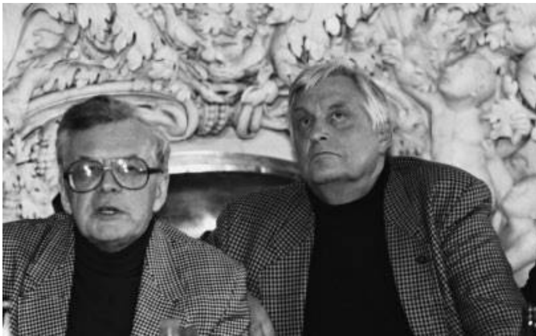
С Олегом Басилашвили. 1997

Кстати, моего героя Бузыкина в «Осеннем марафоне» зовут Андрей Павлович. Я наблюдал за манерой поведения Петрова и, конечно, ни в коей мере не стремился ее копировать, но эта мягкость поведения, улыбка вечная на устах, несколько даже виноватая (а в чем виноватиться – великий композитор!), но все же чуть виноватая улыбка и заикание его, которое, как мне казалось, шло от излишнего почтения к собеседнику, – это все свойственно и моему Бузыкину.