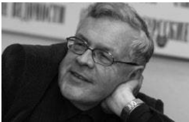
Пресс-конференция в редакции газеты «Санкт-Петербургские ведомости». 2005.