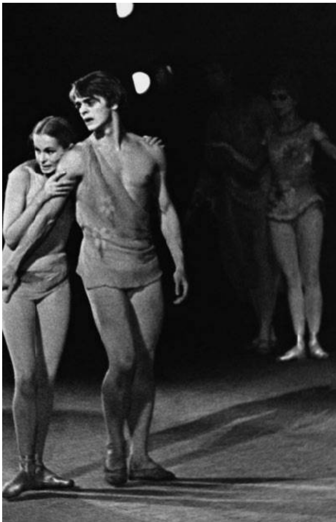
«Сотворение мира», 1971