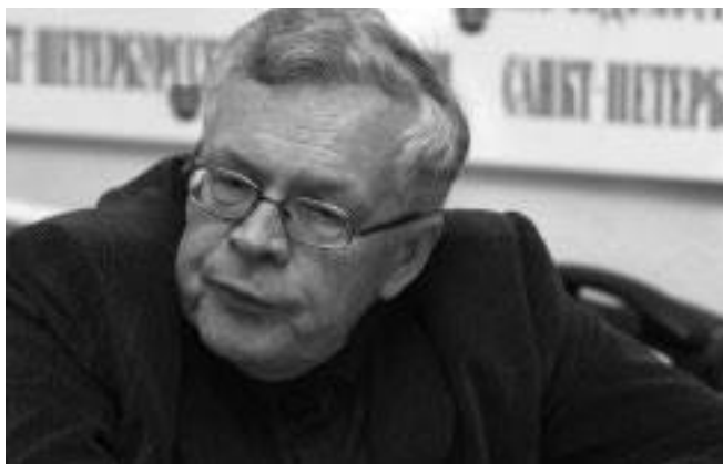
Пресс-конференция в редакции газеты «Санкт-Петербургские ведомости». 2005.

Да, он так и остался для меня загадкой. И навсегда он будет для меня личностью и бесконечно близкой, и бесконечно далекой.