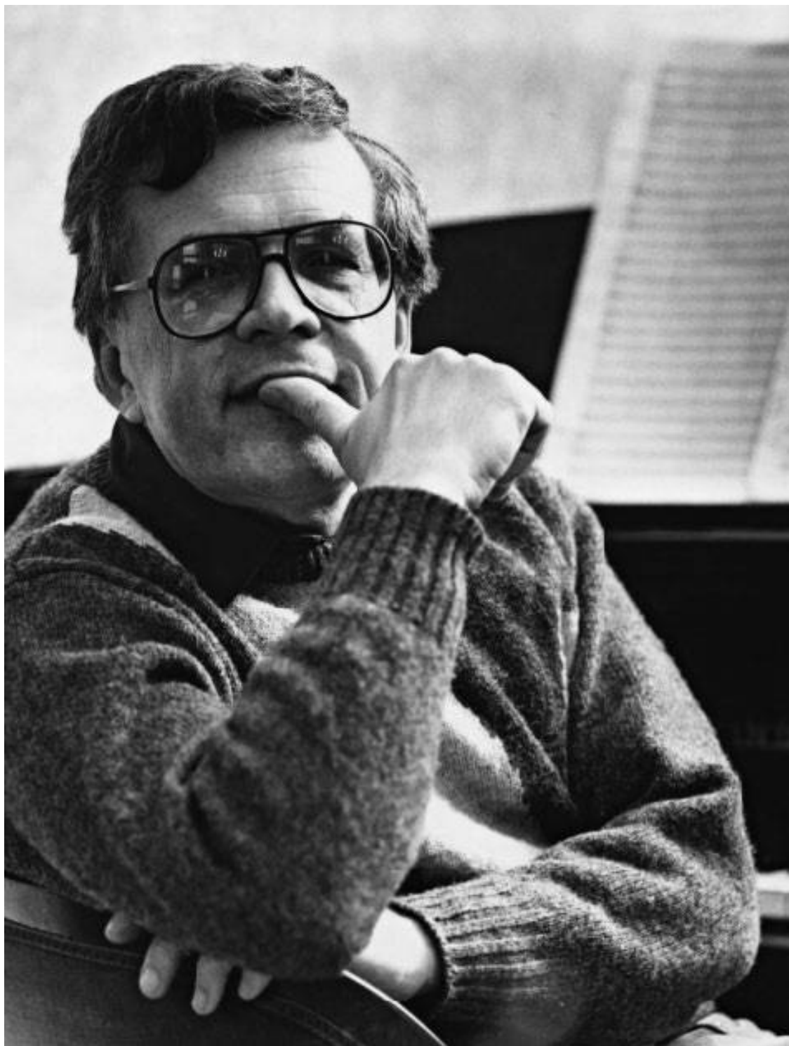
А. Петров. Конец 1980-х.

воле, находя их в творческом уединении. И мы благодарны ему за музыку, с которой легче и светлее живется на белом свете.