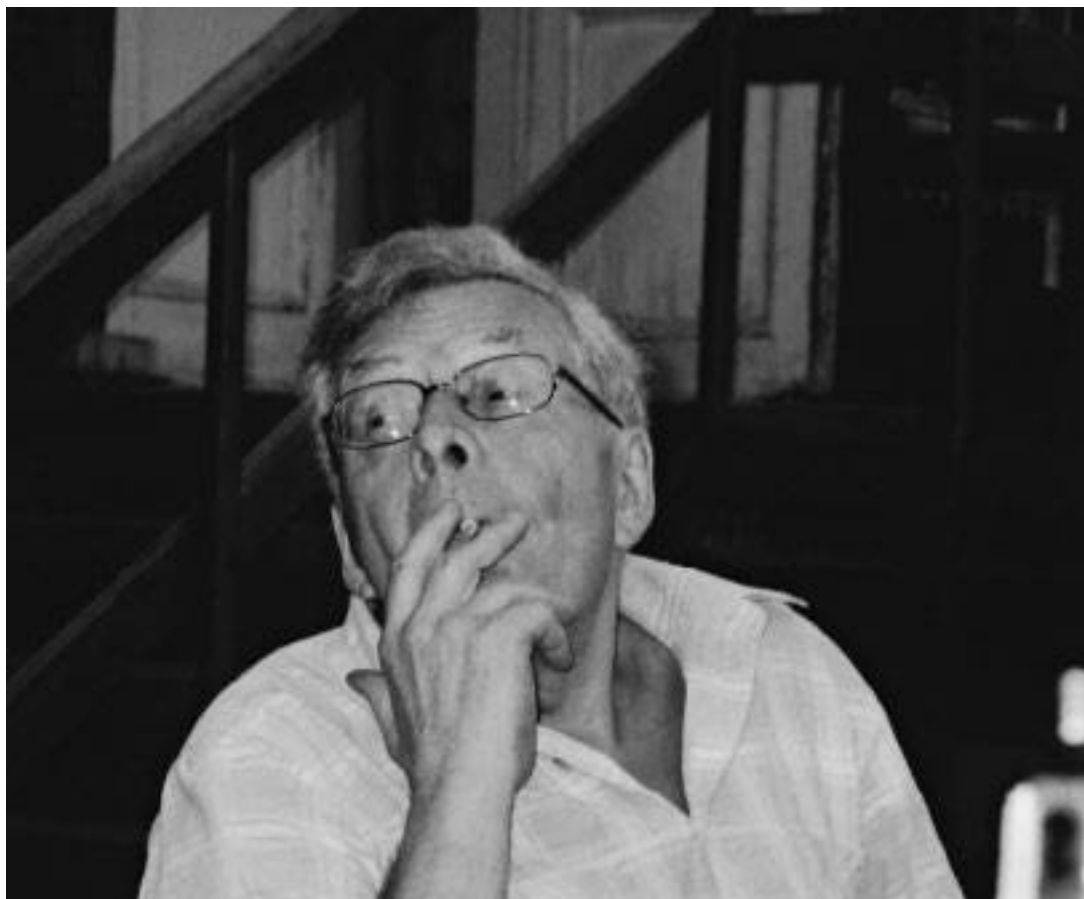
Доза удовольствия: сигарета после работы, под чашечку кофе. На даче. 2005