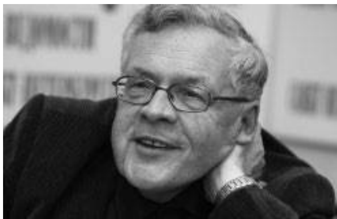
Пресс-конференция в редакции газеты «Санкт-Петербургские ведомости». 2005.

В конце концов, я купил квартиру в соседнем с ним доме, принадлежащем военно-морскому ведомству. Само ощущение соседства с ним было, в первую очередь, даже не географическим, а человеческим. И когда я слышу его музыку, мне всегда кажется, что она адресована и лично мне.