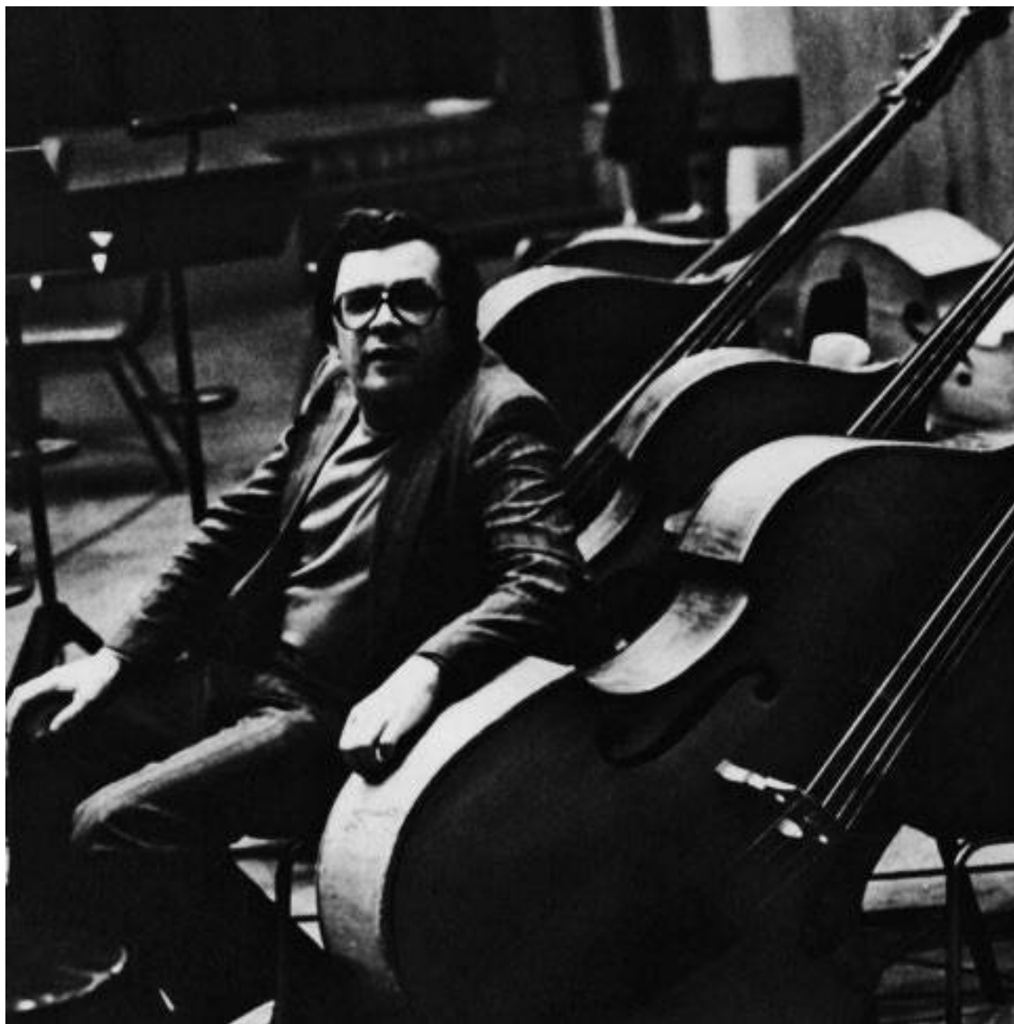
Запись музыки на тон-студии «Мосфильма». Конец 1970-х

«Нет, в Апраксином». – «А знаете, у меня точно такая же рубашка есть, только цвет чуть-чуть более нежный». Он вовлекает меня в разговор, и я уже забываю, о чем говорил. Потом спохватываюсь, пытаюсь продолжить. Но он с таким же упорством начинает разговор о галстуках или о том, что сейчас модно, а что не очень.