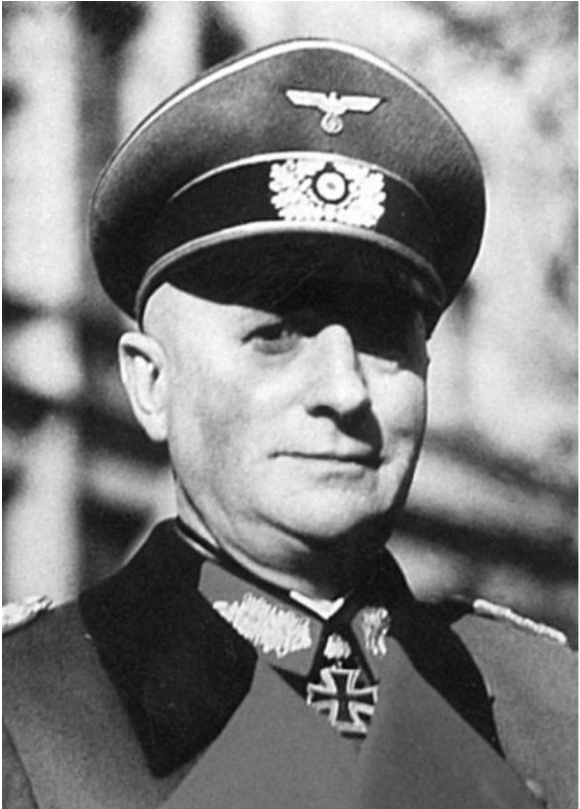
Генерал-полковник Йозеф Харпе. В 1932–1933 гг., будучи ещё просто полковником, он занимал должность начальника казанской танковой школы.

Итак, картина та же, что и в Липецке. Начальником казанской танковой школы был офицер рейхсвера – в 1929 году этот пост занимал подполковник В. Мальбрандт (Malbrandt), в