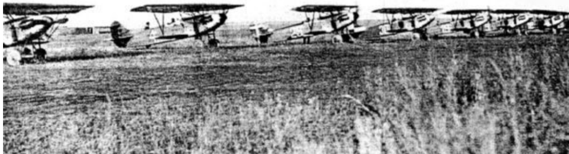
Истребители «Фоккер Д-ХІІІ» на лётном поле липецкой авиашколы

и все транспортные расходы, в том числе и перевозку по советской территории от Ленинградского порта до Липецка 32 .