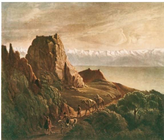
Михаил Лермонтов. Кавказский вид с верблюдами. 1837

Литературный музей Института русской литературы (Пушкинский дом), Санкт-Петербург