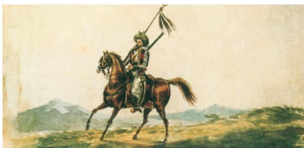
Михаил Лермонтов. Кавказский горец верхом. 1836 Акварель

Обычно дуэли проводились не ранее, чем на следующее утро после состоявшегося вызова. Проведение дуэли немедленно после принятия вызова было значимым отступлением от нормы. Подготовка к дуэли требовала времени. За то время секунданты должны были согласовать время, место и условия дуэли, возможно, осуществить попытки к примирению сторон, то есть выполнить обязательные требования, связанные с правильной ее организацией.