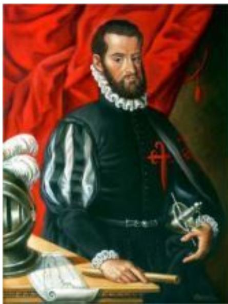
Педро де Авилес. Гравюра XVI в.

Испанцы зверски расправлялись с теми, кто осмеливался появиться в американских водах и тем более высаживаться на побережье испанской Америки. Когда, к примеру, бежавшие из Франции гугеноты образовали свое небольшое поселение во Флориде, испанский король немедленно направил туда карательный отряд под началом некоего Педро де Авилеса. Все население, включая женщин и детей, было вырезано, причем не потому, что они были французы, а потому, что протестанты.