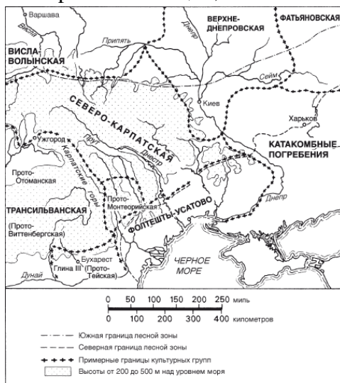
Рис. 3. Районы распределения курганов северокарпатского типа и соседней более поздней шнуровой керамики в первой половине второго тысячелетия до н. э.

Выявленную археологическими раскопками связь культур бронзового и раннего железного веков в данном районе подтверждается данными лингвистических исследований. Еще в 1837 г. словацкий ученый Шафарик установил, что прародина славян находится к северу от Карпатских гор и включает в себя районы Галиции, Волыни и Подолья.