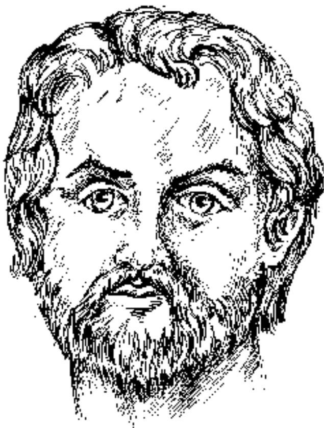
Царь Македонии Филипп II

Свадьба проходила в Эгах – древней столице Македонии. Большой праздник, устроенный Филиппом, был своеобразной демонстрацией всем балканским подданным, эллинам и македонцам могущества Македонской державы, а также символом восстановления семейного мира.