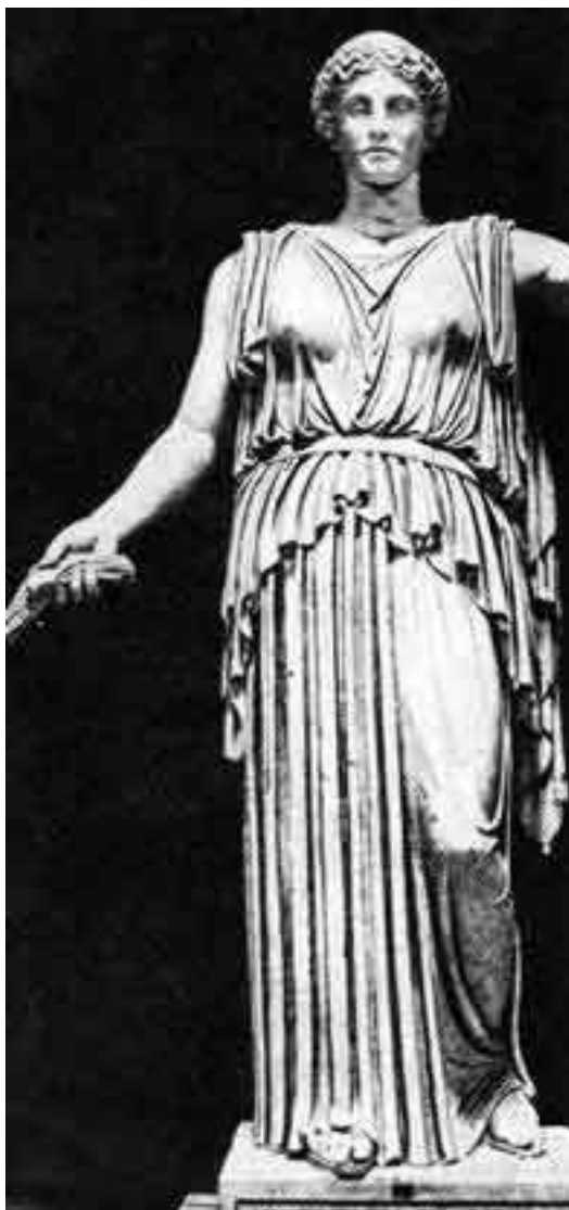
«Деметра» в пеплосе классического периода. Римская копия с греческой статуи

Об утонченности эпохи свидетельствуют драгоценные украшения – ожерелья, кольца, диадемы, браслеты и серьги, в изобилии дополнявшие женское платье. У каждой аристократки имелись небольшое зеркало в резной раме, с изящной ручкой, веер, зонтик от солнца из полотна или шелка, пояса из золота или серебра. Темный от природы цвет волос античные дамы стремились осветлить в соответствии с признанными канонами красоты.