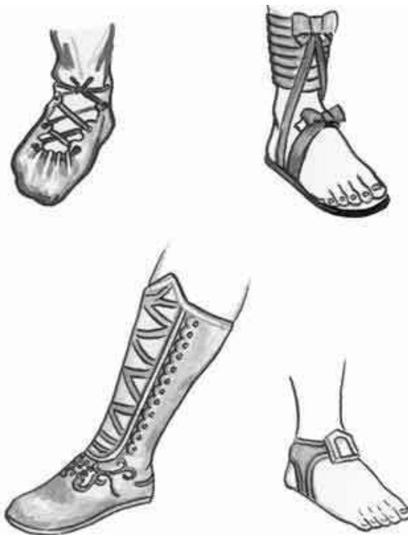
Римская обувь: а – карбатин; б – calceus – сандалии республиканской эпохи; в – сапог периода империи; г – коптские сандалии

Ранняя обувь римлян лишь выполняла свое предназначение и еще не удостоверяла статуса человека. Сандалии не украшались и полностью обнажали ногу. Позже появилось множество ремешков, стали закрываться пальцы, чем, собственно, обувь римлян отличалась от греческой. Самым простым и наиболее распространенным видом античной обуви был карбатин – кусок сыромятной кожи, вырезанный в форме подошвы, крепившийся к щиколотке шнурками. В республиканский период сановники носили сандалии solea , представлявшие собой подошву, привязанную к ноге узкой тесемкой.